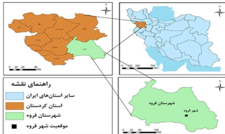
شکل ۱: مکانیابی شهر قروه

قروه یکی از شهرستان‌های استان کردستان در غرب ایران است، که رشد و توسعه این شهر در امتداد جاده ارتباطی سنندج- همدان انجام پذیرفته است. این شهرستان در سال ۱۳۹۵ بالغ بر ۱۸۷,۳۴۲ نفر جمعیت داشته است.