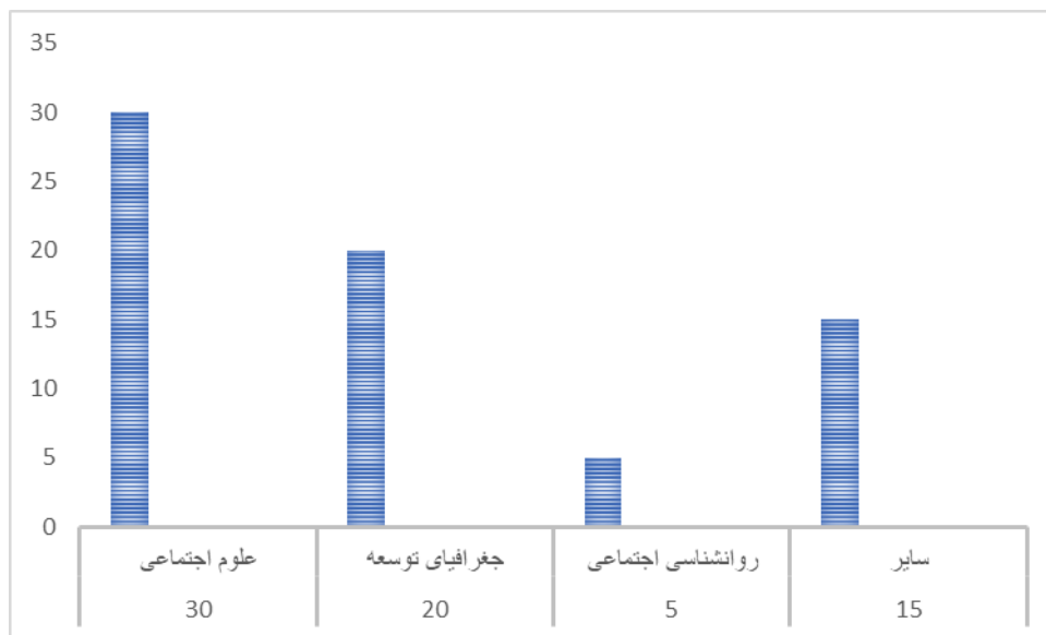
شکل ۳: تخصص علمی