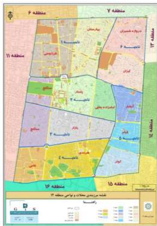
محله های منطقه ۱۲ - حوزه بندی شده