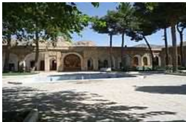
نمایی از حیاط قلعه

های ضلع غربی که به نحو بسیار زیبای اجرا گردیده بر جای‌ها معمول بوده که بقایایی از آن در یکی از اتاق‌آینه کاری در سقف اتاق سنگ ازاره نمای است. نشین به صورت نقوشی از گل و گیاه اجرا گردیده گچبری بر روی دیوارها و سقف اتاق شاه است. مانده‌های اسلیمی مختلف آن، در نمای دیوار بکارهای تراشیده شده مستطیلی شکل است که حالت برجسته نقش بیرونی دیوار از سنگ است. رفته شده