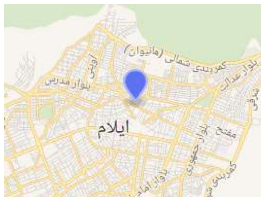
نقشه هوایی از قلعه والی ایلام