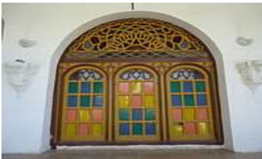
های قلعه والی ایلامنمایی از درب یکی از اتاق

ها، داخل حیاط و پشت بام قلعه آجر فرش و ملات گل و آهک بوده که در بازسازی با ملات ماسه و سیمان پوشش کلیه کف اتاق برای جلوگیری از نفوذ رطوبت به داخل قلعه در هنگام بازسازی بدین ترتیب اقدام شد. جایگزین گردید های قبلی که شامل آجر فرش و ملات کاه و گل بود برداشته شد، سپس روی بام قیر اندود شد و بر روی لایه قیر که ابتدا لایه ها یک لایه آسفالت به ضخامت سه سانتیمتر و یک لایه ایزوگام و آسفالت اجرا گردید و برای حفظ شکل پیشین قلعه بر روی آن آجر فرش کشیده شد.