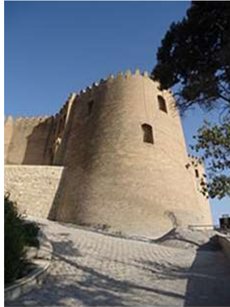
عکس ۳: برج جنوب غربی

معماری کنونی بنا، بیانگر الحاقات فراوانی است که در دوران‌های گوناگون بدان افزوده شده، بیشترین این تحولات مربوط به دوره صفویه تا قاجار می‌باشد. بر اساس مدارک تصویری تا حدود یکصد سال پیش بارویی دوازده برجی در پیرامون بنای فعلی وجود داشته، که اکنون آثار این برج از آن در محوطه شمال غربی قلعه، قابل مشاهده است. وسعت تقریبی بنا ۵۳۰۰ متر مربع، شامل ۸ برج دو صحن و ۳۰۰ جان پناه می‌باشد. ارتفاع بلندترین دیوار تا سطح تپه ۲۳ متر و مصالح آن از سنگ آجر، خشت و ملات گچ و آهک است. ورودی بنا به سمت شمال و در بدنه برج جنوب غربی تعبیه شده که پس از گذر از راهرو ورودی به حیاط اول وصل می‌گردد. ورودی قلعه فلک‌الافلاک در جبهه شمالی و در برج جنوب غربی به عرض ۱۰ متر و ۲۰ سانتیمتر و ارتفاع سه متر ساخته شده و در ساخت این بنا از مصالحی چون خشت، آجر (قرمز و بزرگ)، سنگ و ملات استفاده شده است. پلان بنای این قلعه تاریخی به صورت هشت ضلعی نامنظم است