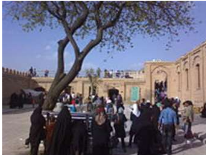
عکس ۵: نمایی از حیاط اول

ابعاد این حیاط که جهت شمالی، جنوبی طراحی شده ۳۱ \times ۵/۲۲ متر است. پیرامون آن از چهار برج تشکیل شده که دو برج آن در شمال و شمال غربی و دو برج دیگر در جنوب و جنوب غربی قرار دارد.