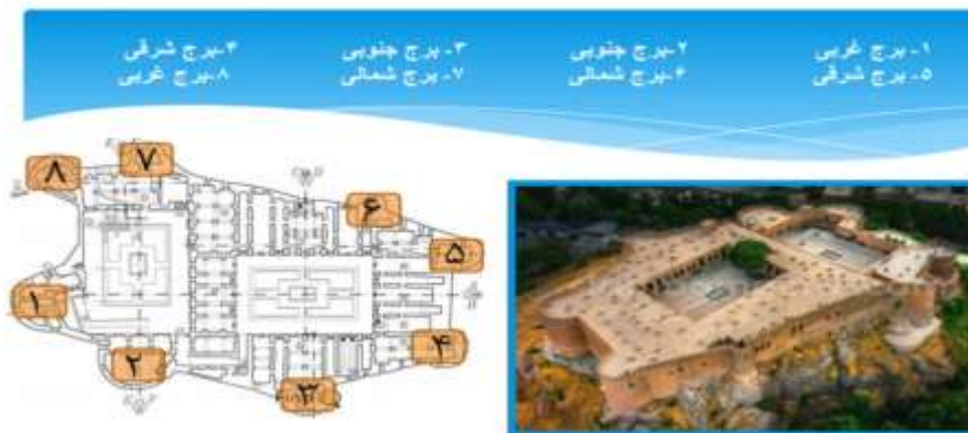
عکس ۴: برج های قلعه

معماری کنونی بنا، بیانگر الحاقات فراوانی است که در دوران‌های گوناگون بدان افزوده شده، بیشترین این تحولات مربوط به دوره صفویه تا قاجار می‌باشد. بر اساس مدارک تصویری تا حدود یکصد سال پیش بارویی دوازده برجی در پیرامون بنای فعلی وجود داشته، که اکنون آثار این برج از آن در محوطه شمال غربی قلعه، قابل مشاهده است. وسعت تقریبی بنا ۵۳۰۰ متر مربع، شامل ۸ برج دو صحن و ۳۰۰ جان پناه می‌باشد. ارتفاع بلندترین دیوار تا سطح تپه ۲۳ متر و مصالح آن از سنگ آجر، خشت و ملات گچ و آهک است. ورودی بنا به سمت شمال و در بدنه برج جنوب غربی تعبیه شده که پس از گذر از راهرو ورودی به حیاط اول وصل می‌گردد. ورودی قلعه فلک‌الافلاک در جبهه شمالی و در برج جنوب غربی به عرض ۱۰ متر و ۲۰ سانتیمتر و ارتفاع سه متر ساخته شده و در ساخت این بنا از مصالحی چون خشت، آجر (قرمز و بزرگ)، سنگ و ملات استفاده شده است. پلان بنای این قلعه تاریخی به صورت هشت ضلعی نامنظم است