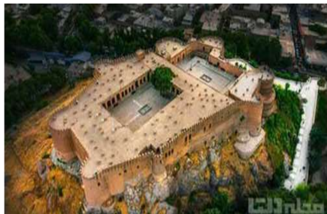
شکل ۲: فرم قلعه