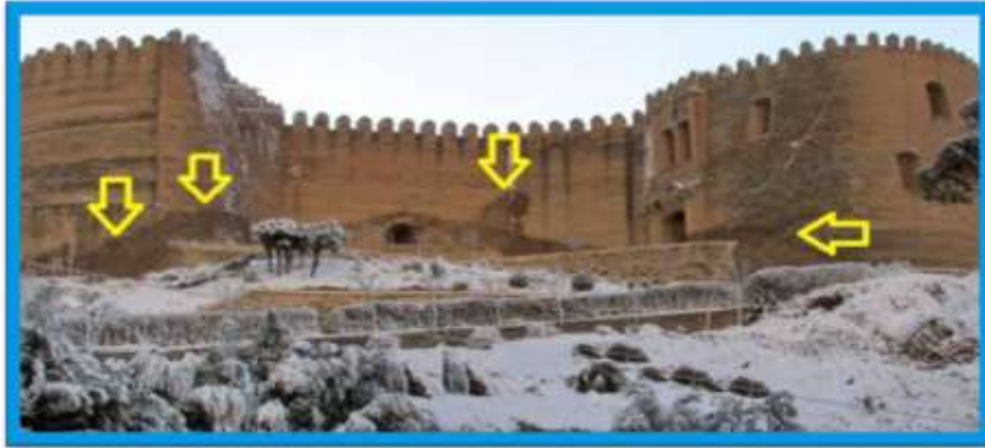
فصل ۸: تصویر اولیه قبل از مرمت

در نیمه ابتدایی سال ۱۳۸۹ فصل اول مرمت قلعه فلک‌الافلاک با هدف حفاظت و مرمت این اثر باستانی از طرف سازمان میراث فرهنگی، صنایع دستی و گردشگری استان لرستان به اتمام رسید. در این طرح مرمت آبروهای کف حیاط با سنگ تراشیده شده به ضخامت ۶ سانتیمتر، بندکشی و تعویض آجرها، دوباره چینی کنگره‌های تخریب شده و قوس طاق‌های قلعه و همچنین مرمت مهار در و پنجره‌های ورودی قلعه به اتمام رسید.