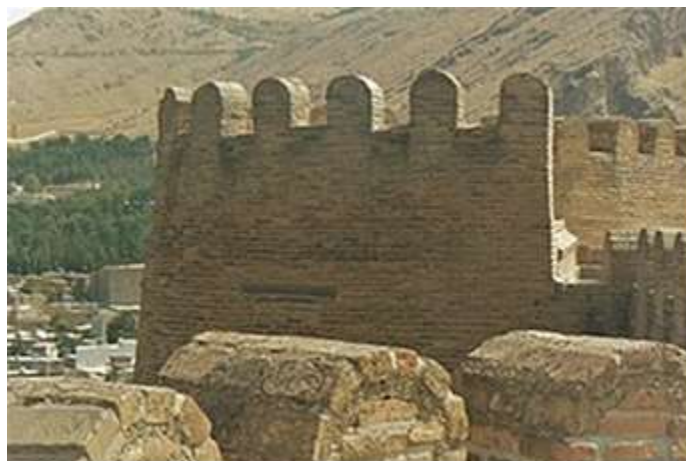
شکل ۱: یکی از برج های شمالی قلعه

این قلعه به لحاظ موقعیت استراتژیکی خود در قرن چهارم هجری قمری به عنوان مقر حکومت آل حسنویه و گنجور در زمان آل بویه درآمد همچنین خزانه حکومتی خاندان بدر در قرن چهارم هجری و مقر حکومتی اتابکان لر کوچک و والیان لرستان در دوره صفویه تا قاجار و سرانجام پادگان نظامی و زندان سیاسی در دوران پهلوی اول و دوم از مهم ترین کاربردهای قلعه در گذشته محسوب می شود.