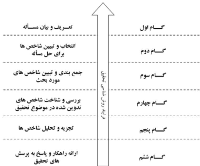
شکل شماره ۱ نمودار فرایند روش‌شناسی تحقیق