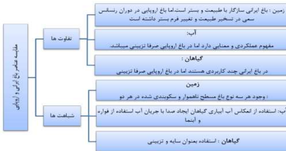
نمودار شماره ۲- مقایسه عناصر مهم معماری باغ ایرانی و اروپایی