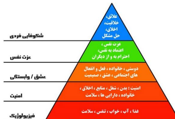
تصویر ۱ سلسه مراتب نیازهای انسان از نظر مازلو