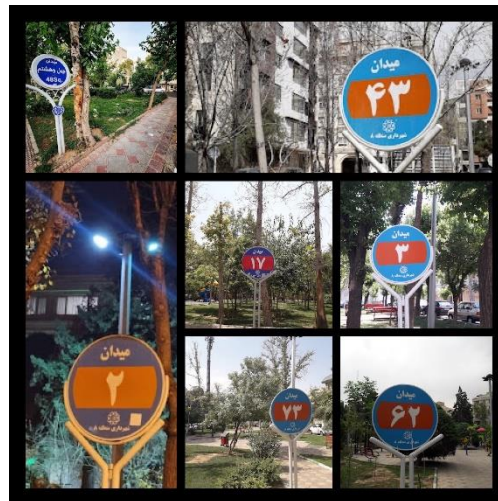
عکس ۱ مبلمان شهری میادین محله نارمک

مبلمان شهری: در میدان‌های نارمک آلودگی نمادی که باعث اختلال در مسیریابی می‌شود وجود ندارد و مسیریابی به راحتی صورت می‌گیرد. ابتدا و انتهای این میادین با تابلوهایی نام‌گذاری شده است. مسیرهای ورودی و خروجی به هر میدان به گونه‌ای است که با ورود به محوطه میدان، تابلو کاملاً مشخص است. اغلب مسیرهای فرعی جز ورودی‌های اصلی دسترسی دیگری ندارند و دورتادور