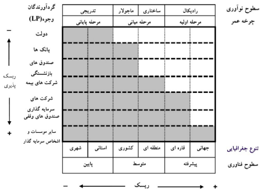
رابطه گردآوردندگان وجوه و سرمایه‌گذاری صندوق سرمایه‌گذاری

۳) نیازهای سرمایه‌پذیران مختلف است، بدین ترتیب که برخی فقط نیازهای مالی دارند و برخی دیگر نیازمند خدمات حسابداری، مدیریتی، بازاریابی، حقوقی و... می‌باشند. بنابراین درسه مورد ذکر شده بالا حجم کار صندوق در زمان عقد بستن مجهول می‌باشد. (د) معلوم نیست کدام پروژه شکست خورده و کدام موفق می‌شود، همچنین از پروژه‌های موفق نیز مشخص نیست از هر کدام چه میزان سود به دست می‌آید. بدین ترتیب اجرت صندوق که درصدی از سود به دست آمده خواهد بود نیز مجهول می‌ماند.