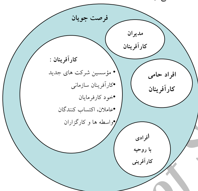
شکل شماره ۲ - جایگاه کارآفرینی از جنبه فرصت جویان

در حقیقت توسعه‌ی آموزش کارآفرینی، شامل شیوه‌های جدید آموزشی و تعیین نقش‌های نوین دانشجویان و استاد در فرآیند آموزش کارآفرینی می‌باشد. در واقع افرادی را که می‌توانند تحت نظام آموزش و ترویج کارآفرینی در کشاورزی قرار بگیرند در شکل زیر قابل ملاحظه می‌باشند: