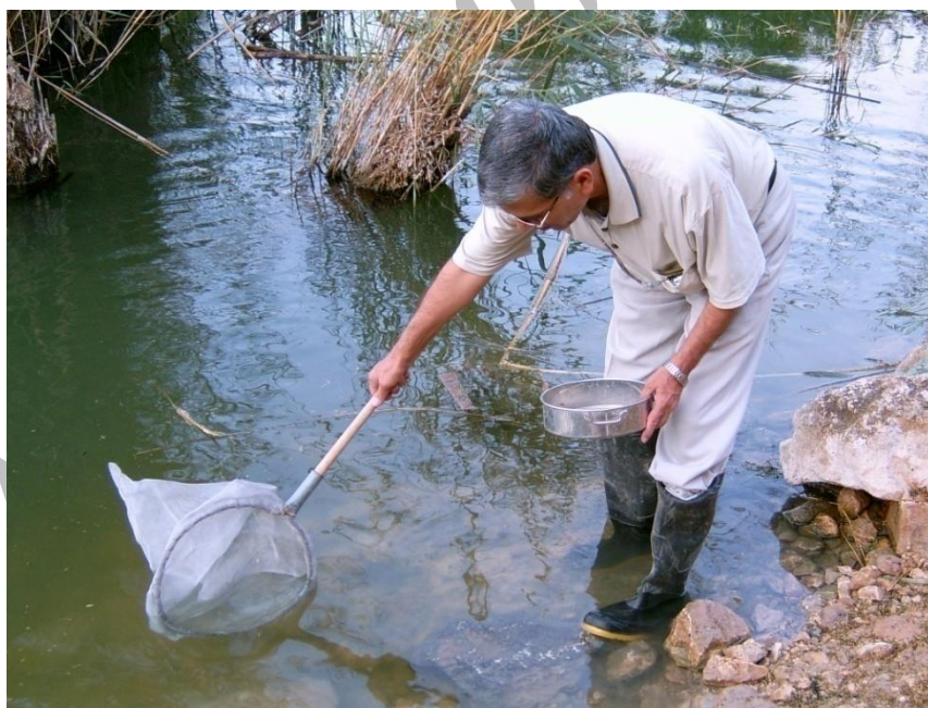
شکل 3: نحوه جمع آوری حشرات آبی در کنار پوشش گیاهان آبی دریاچه پریشان