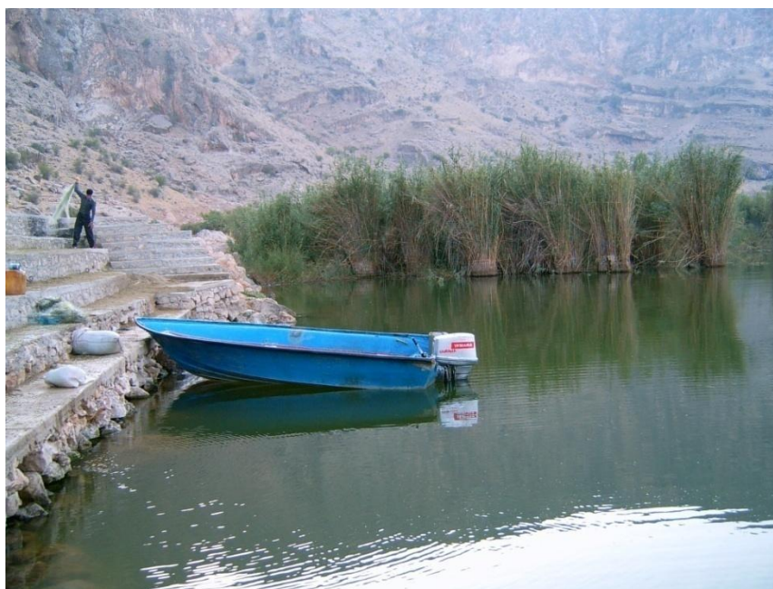
شکل 2: نمایی از ساحل شمالی دریاچه پریشان (تابستان 1385).