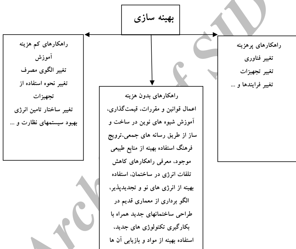
شکل ۱- راهکارهای غیرقیمتی اصلاح الگوی مصرف

راهکارهای اجرایی بهبود و ارتقاء کارایی انرژی را می توان در بخش راهکارهای قیمتی و راهکارهای غیرقیمتی تقسیم بندی نمود. با توجه به اینکه راهکارهای قیمتی و سیاست های قیمتگذاری به دلیل پیچیدگی های خاصی که در اقتصاد ایران وجود دارد بسیار مشکل است و غالباً همراه با سعی و خطا بوده و تبعات اقتصادی فراوانی را برای جامعه دارا می باشد، لذا شناسایی راهکارهای غیرقیمتی اصلاح الگوی مصرف انرژی در ایران می تواند گزینه مناسب تر و سهل الوصول تری باشد و نیز تبعات اقتصادی منفی کمتری را به همراه خواهد داشت .