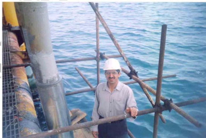
شکل ۴- نمونه ای از رایزر نفت که در منطقه نفتی سلمان توسط دانشگاه صنعتی اصفهان روکش شده است.

فضای بین روکش و لوله رایزر به کمک نوعی کامپوزیت مقاوم در برابر حرارت و دارای استحکام مکانیکی و مقاومت خوردگی عالی پر می شود. این سیستم به دلیل آنکه شامل مجموعه ای از اجزاء فلزی، غیر فلزی و پلیمری می باشد دارای استحکام مکانیکی و مقاومت خوردگی عالی می باشد. علاوه بر این سطح خارجی این سیستم فلزی می باشد، بخوبی در برابر پرتوهای UV آفتاب مقاومت می کند. در شکل (۴) نمونه ای از رایزر نفت که در حوزه نفتی سلمان روکش شده است مشاهده می شود.