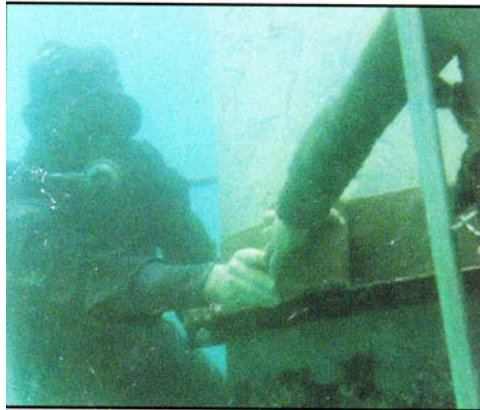
شکل ۱- در این شکل اعمال بازدارنده خوردگی و نیز روکش در زیر آب مشاهده می شود.

امکان سند بلاست ناحیه جزر و مد و پاشش آب وجود دارد ولی پاشش آب موجب بروز مشکل در سند بلاست و خوردگی مجدد سطح می شود. این موضوع مشکلی در روند اجرای روکش ایجاد نمی کند و با اجرای عملیات آماده سازی بعدی بخوبی برطرف می شود (در قسمت های بعدی توضیح داده می شود). اگر هدف اعمال پوشش از ناحیه پائین جزر و مد باشد، به دلیل وجود آب، سند بلاست این ناحیه کمی با مشکل روبرو خواهد بود. برای برطرف کردن این مشکل، محفظه خشک کوچکی در اطراف رایزر ایجاد می شود.