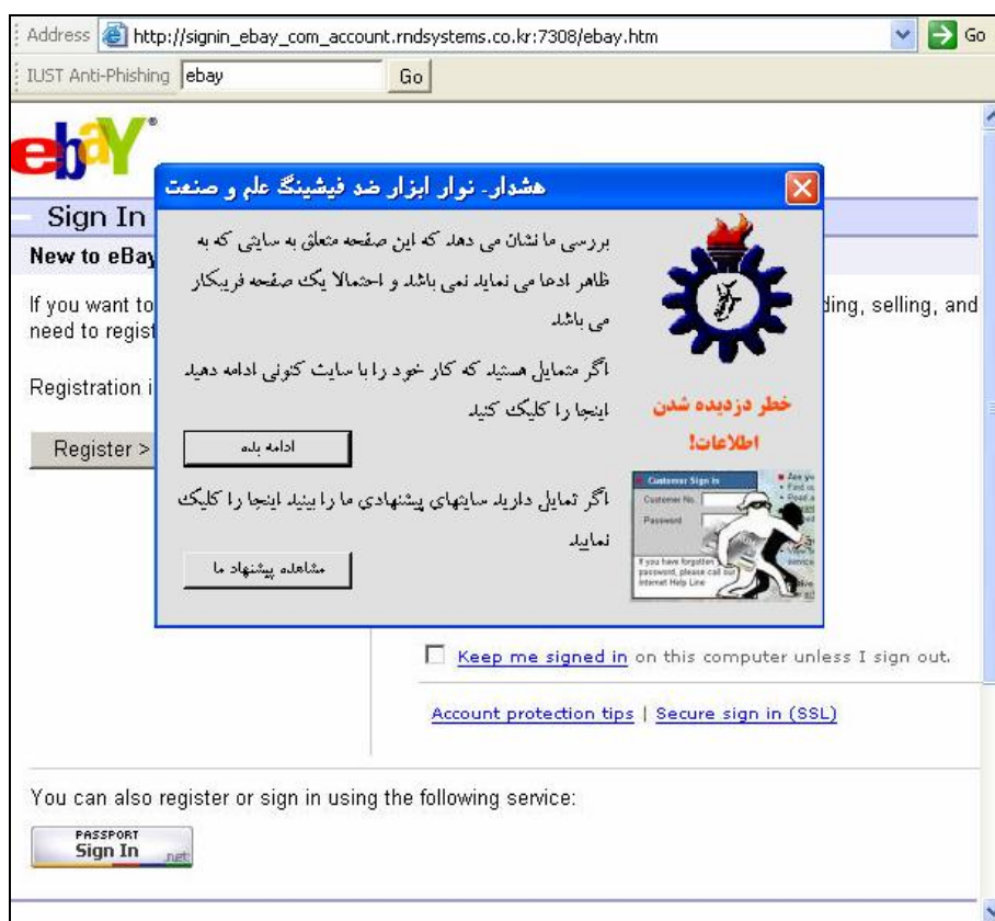
شکل ۳: نوار ابزار ضدفیشینگ علم و صنعت در مواجهه با سایت فیشینگ