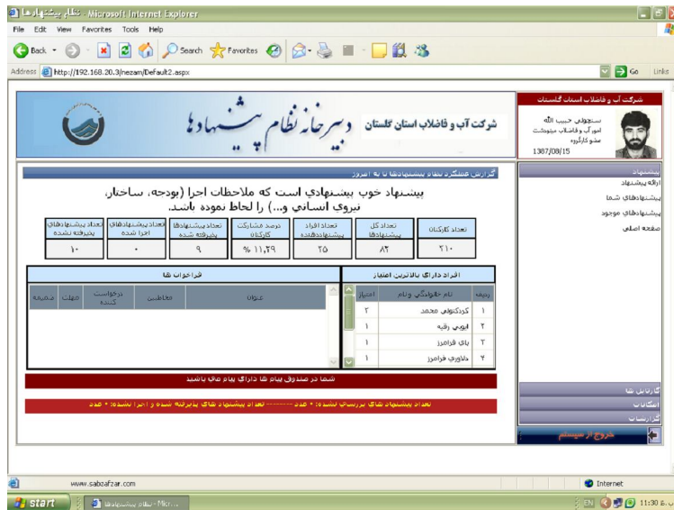
نمونه نرم افزار نظام پیشنهادات (شکل شماره 2)