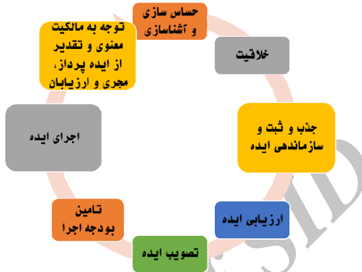
شکل ۱- چرخه ایده پردازی و نوآوری شهری