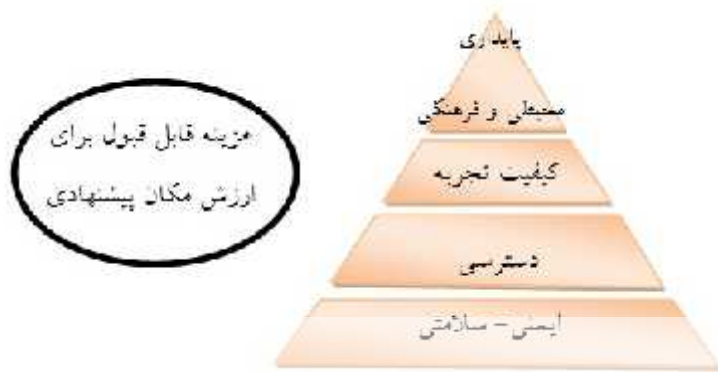
شکل ۴- نیازهای گردشگران