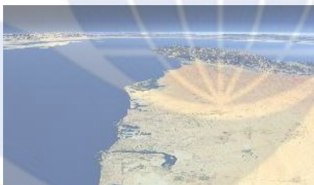
شکل ۱- نمای جنوبی تنگه هرمز