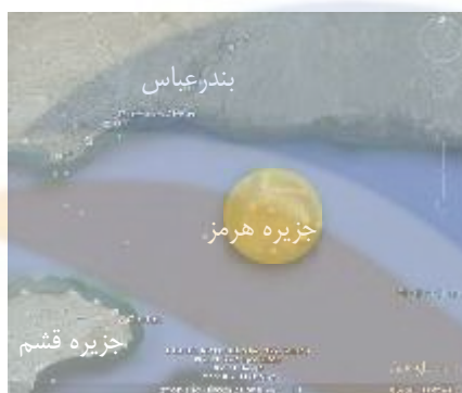
شکل ۲- موقعیت جزیره هرمز نسبت به بندرعباس و جزیره قشم

این مقاله بصورت میان‌رشته‌ای (معماری- شهرسازی- محیط زیست) مشکلات مدیریتی ناشی از گردشگری در جزیره هرمز را که منجر به تخریب محیط‌زیست و برهم‌زدن اکوسیستم منطقه شده، تحلیل می‌کند و با تطبیق اصول مدیریتی مناطق ساحلی با اصول اکوتوریسم، تبدیل شدن جزیره به اکوتوریسم را راهکاری مناسب جهت مدیریتی یکپارچه در جهت حل آن پیشنهاد می‌کند و نشان می‌دهد که تبدیل شدن جزیره به اکوتوریسم نه تنها برای مدیریت سواحل مناسب، بلکه در زمینه اقتصادی، کالبدی، تأمین منابع، مسائل اجتماعی، فرهنگی و رفح نیازهای جوامع محلی نیز تأثیر بسزایی دارد.