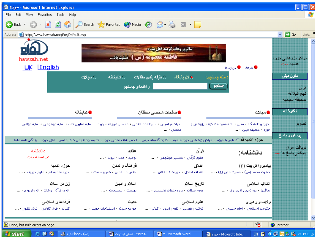
شکل 2 صفحه آغازین پایگاه حوزه