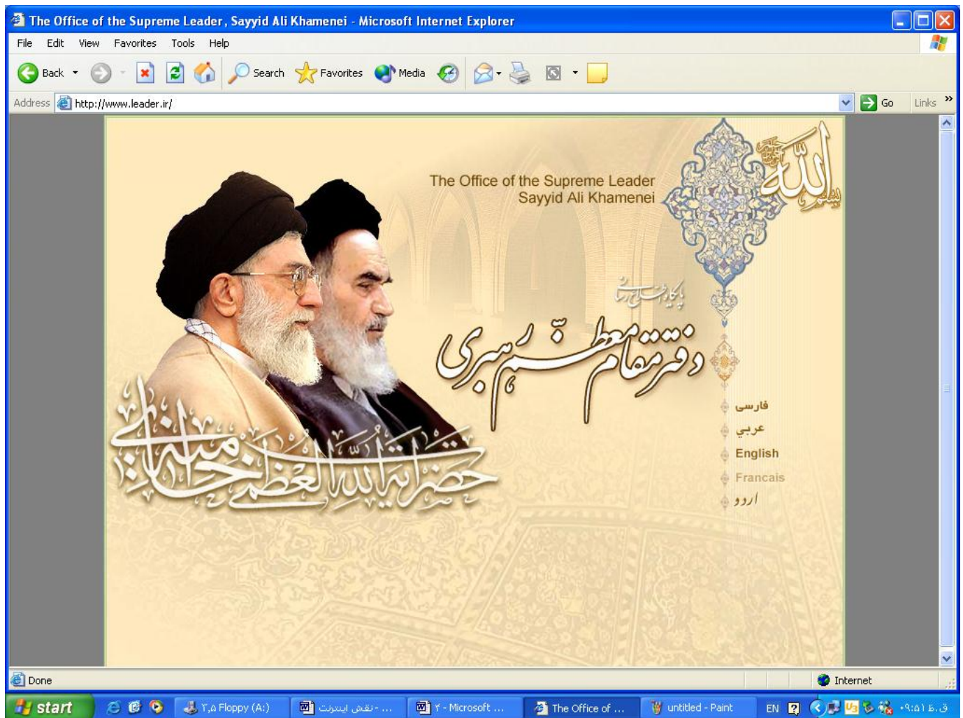
شکل 3 صفحه آغازین پایگاه ولایت