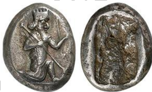
تصویر 7 - سکه شیکل