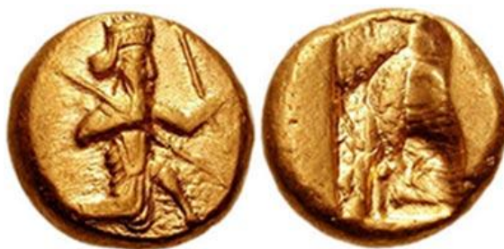
تصویر 6 - سکه دریک

1. سکه‌های شاهان هخامنشی؛ به دو صورت، دریک از طلا و شیکل از نقره ضرب می‌شده‌اند که روی سکه به‌طور معمول نقش شاه به‌صورت نیزه‌دار به‌جز سکه‌های داریوش سوم که شاه را خنجر به دست می‌نمایاند و پشت آن فرورفتگی نامنظم دیده می‌شود. (تصویر 6 و 7) دو دریکی نیز در زمان داریوش سوم ایجاد شد. بر این سکه‌ها، شیارهای موج، یا نقش دو هلال و یا نقش قسمت جلوی کشتی دیده می‌شود. (تصویر 8)