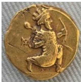
تصویر 8- سکه دودریکی