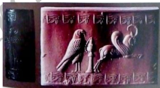
تصویر 1- مهر استوانه‌ای با نقش شاهین و چشم هوروس (از نمادهای مصر باستان) و عودسوز و گاو بالدار (از نمادهای هخامنشی) مأخذ: (محمد پناه، 1385 و 144)

مهرهای استوانه‌ای به‌دست‌آمده از کاوش‌های مارلیک، متعلق به دوران قبل از مادها در ایران و همچنین مهرهای حکاکی شده ملت سومر، مسلم می‌دارد که آشوری‌ها و سپس یونانی‌ها از آن‌ها این هنر را فرا گرفته‌اند. در این میان، نقوش برخی از مهرهای نیمه دوم هزاره چهارم ق.م نمایانگر صحنه‌های مرتبط با کشاورزی از قبیل شخم زدن، بذر پاشیدن و جمع‌آوری غلات است (علی