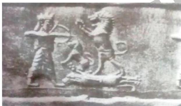
تصویر 5- مهر استوانه‌ای شاه در حال شکار شیر با تیروکمان مأخذ: (دشتی، 1391 و 182)

بنابراین موضوعات روی مهرها معرف منازعه شاه در جدال با جانوران و هیولا بوده و یا صحنه شکار را مانند صحنه‌ای که روی استوانه مشهور داریوش نقش شده است، تصویر کرده‌اند. همچنین باید از حکاکان مسکوکات صادراتی شاهنشاه که همواره شاه را به صورت کماندار مجسم می‌کردند و نقش سکه حکام ایالات غربی یاد کنیم (گیرشمن، 1390 و 201).