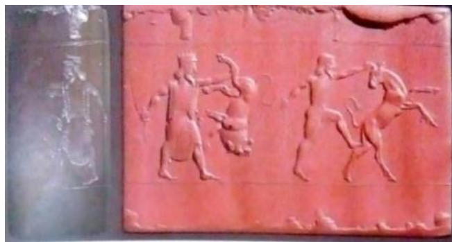
تصویر 4- مهر استوانه‌ای با نقش نبرد پادشاه و پهلوان پارسی با شیر و گاو نر؛ محل کشف: جنوب بین‌النهرین عراق مأخذ: (محمد پناه، 1385 و 144)