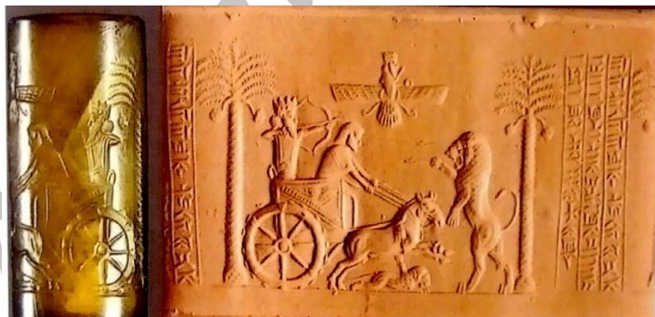
تصویر 2- مهر استوانه‌ای داریوش بزرگ- محل کشف: معبدی آمون مصر

از مهرهای معروف می‌توان به مهر منصوب به کوروش اول اشاره کرد. صحنه نقش شده بر روی آن به سبک هنری دوره ایلامی متأخر است. این صحنه مردی را سوار بر اسب نشان می‌دهد که با نیزه‌ای به دشمنان خود حمله می‌کند. درحالی‌که دو دشمن کشته شده و در زیر سم اسب او افتاده‌اند. از آثار مهم یافت شده در مصر، مهرهای پادشاهی است که در اکثر ساتراپ‌ها و کشورهای ملل تابعه امپراتوری هخامنشی این مهر پادشاه بزرگ رایج بوده است. چنان‌که در زمان داریوش تمام مقامات عالی‌رتبه، از جمله کلیه استانداران، یک چنین مهری را با نام داریوش داشته‌اند. یک نمونه از مهر داریوش در مصر به دست آمده که فقط یک نمونه منحصر به فرد بوده است و احتمالاً داریوش اول در سال 487 ق.م در مصر آن را به استانداران تازه منصوب شده اعطا کرده بود (ولایتی، 1387 و 96). این مهر از استوانه‌ای بلوری تشکیل شده و تصویر شاه را در کنار ارایه‌ران خود در ارایه‌ای نشان می‌دهد که با دو اسب کشیده می‌شود. درحالی‌که کمانش را به سوی شیری که بر روی پایش در مقابل ارایه ایستاده نشانه رفته است. یک شیر روی زمین مرده و دو طرف تصویر دو درخت نخل قرار دارد. بالای صحنه قرص بالدار نماد اهورامزدا به چشم می‌خورد. لازم به ذکر است این مهر با آنکه نام داریوش بر آن حک شده، مهر شخصی شاه بوده و احتمالاً به یکی از صاحب‌منصبان عالی‌رتبه شاهنشاهی تعلق داشته است (فکری پور، 1391 و 43). (تصویر 2)