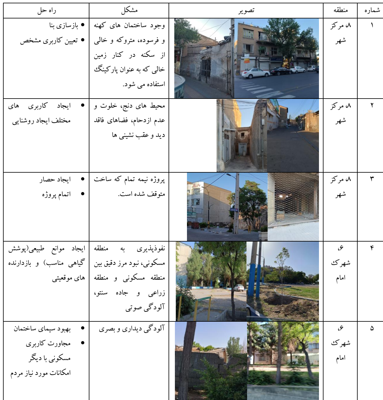
جدول ۳: عوامل بزهکاری و راهکار آن