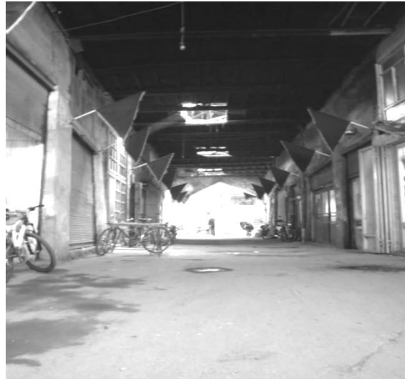
شکل 8: نمونه‌ای از بازارچه‌های ایجاد شده در پشت دروازه‌ها