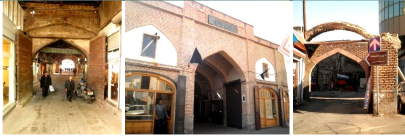
درب خیابان (خیابان قاپیسی)