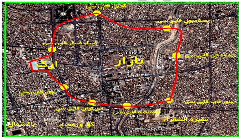
شکل 6: موقعیت حصار و دروازه های قدیمی شهر تبریز

دروازه های تبریز قدیم عبارتند از : دروازه خیابان ، درب اعلی یا دروازه باغمیشه ، درب دوه چی (شتریان) ، درب سرخاب ، درب استانبول ، درب سرد یا دروازه گجیل ، درب مهادمهین یا میارمیار و درب نویر