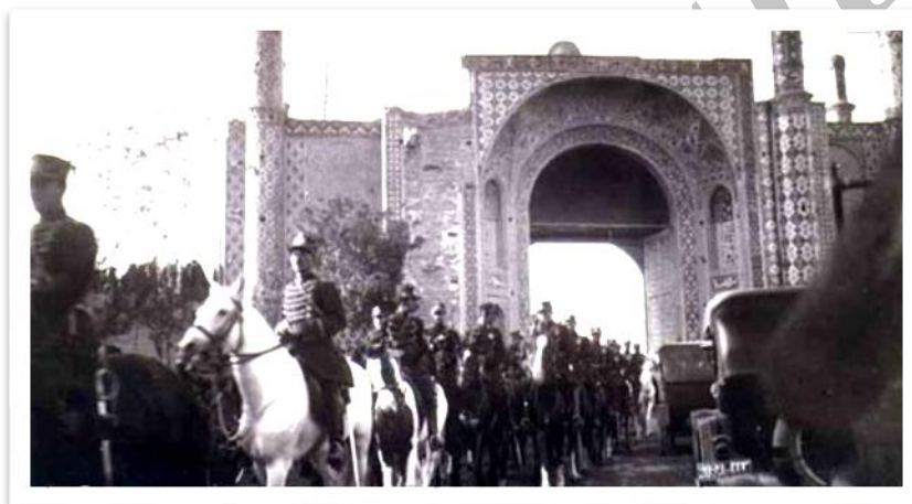
شکل 3: نمونه ای از دروازه‌های قدیمی تهران

در شهر امروز و با فروریزی حصارها، هرچند کالبد دروازه‌ها تغییر شکل یافته است اما بازسازی آن‌ها همواره تداعی کننده خاطره‌های جمعی شهروندان بوده و می‌تواند موجب خوانایی شهر و بیان کننده هویت مدنی و با تکیه بر تاریخ کهن برانگیزنده احساس غرور ریشه دار مردم شهر گردد.