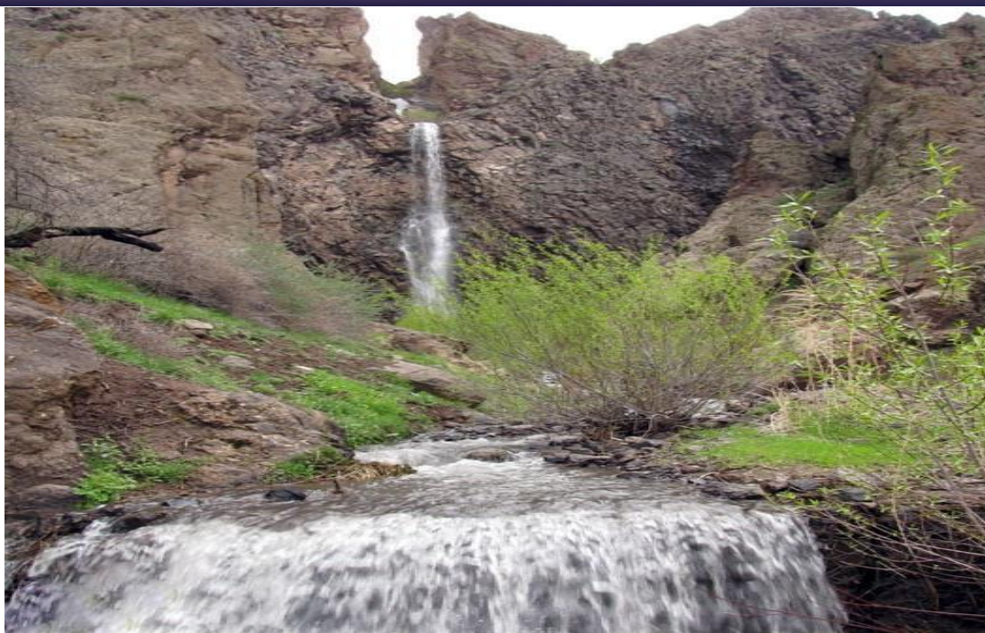
عکس شماره (۴) آبشار شله بن