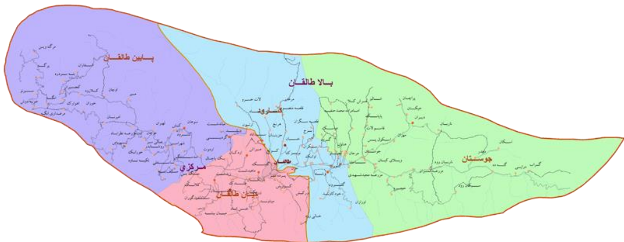
عکس شماره (۱) نقشه طالقان و بخش های آن