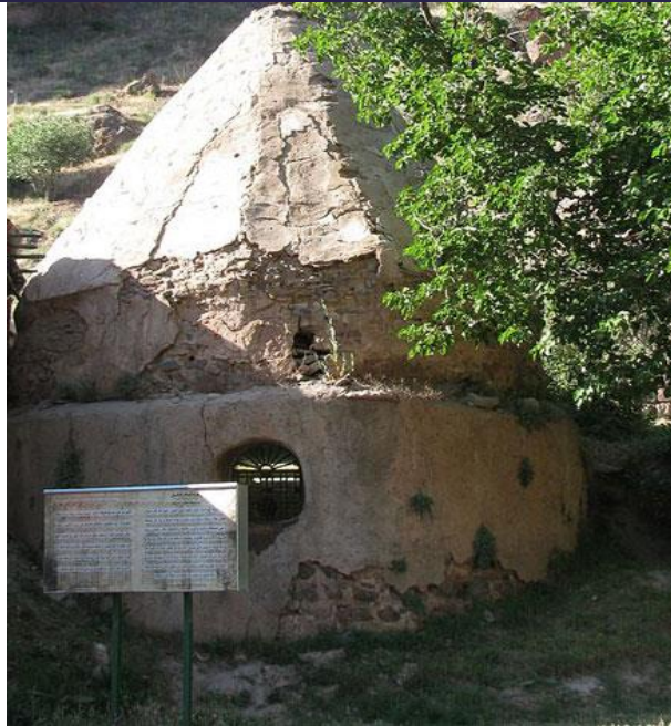
عکس شماره (۵) امامزاده هارون در جوستان