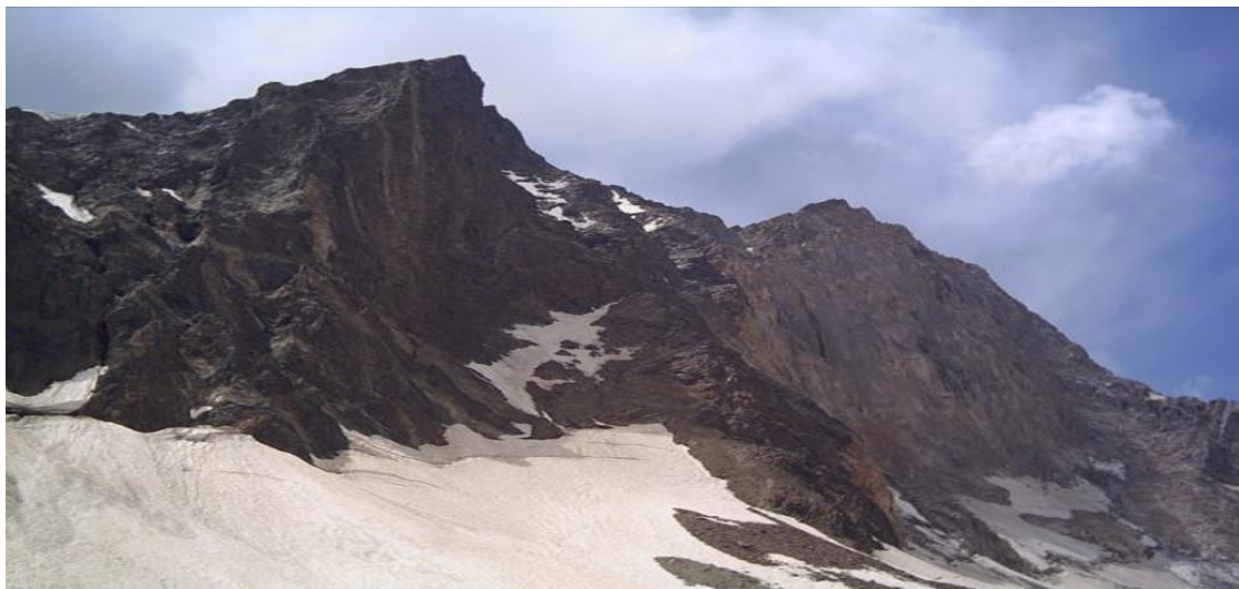
عکس شماره (۳) علم کوه

شمار بسیاری از گردشگران خارجی برای بازدید از دیواره ی علم کوه و نیز صعود به قله ، طالقان می آیند. علم کوه دارای چشم اندازه‌های بسیار زیبا و حیرت انگیزی می باشد که افراد را مجذوب می کند.