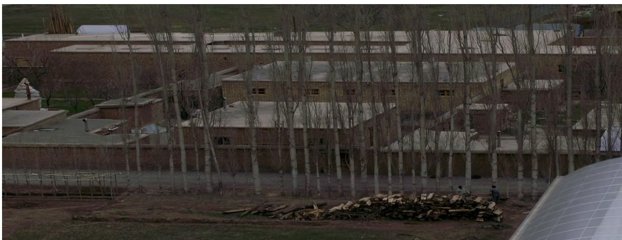
عکس شماره (۲) نمایی از روستای منتظران

اقتصاد اهالی روستای منتظران (ایستا) بر پایه ی کشاورزی و دامداری است و تمامی مواد خوراکی و پوشاکی را خود تهیه می کنند و مخارج خود را در ابتدا از فروش زمین های تبریزشان حاصل می کردند. بذر بومی گندم را در زمینی که اصلاحات ارضی نشده و مالک حقیقی آن خودشان هستند با روش گاوآهن کشت می کنند و با قنات و رودخانه آبیاری می کنند و کود حیوانی می دهند. سپس با آسیاب آبی که خودشان درست کرده اند آرد می میکنند و سپس در تنور هایی که خود ساخته اند نان می پزند. ماست و لبنیات را خود فراهم می کنند و از گوشت حیوان نر خوراک میکنند و از پوست آنها لباس تهیه می کنند. معماری خانه هایشان تلفیقی از معماری کویری و نقاط سردسیری است و گچ کارخانه ای یا آهن به هیچ عنوان استفاده نشده است حیاط ها بدون فضا سازی و معماری داخلی خانه ها بسیار ساده است. این افراد شناسنامه ندارند و جز جمعیت ایران محسوب نمی گردند و هیچگونه خدمات دولتی دریافت نمیکنند، دختران و پسران حق ازدواج ندارند زیرا اکنون در رساله ی فقهی میرزا صادق تبریزی حکمی در اینخصوص وجود ندارد.