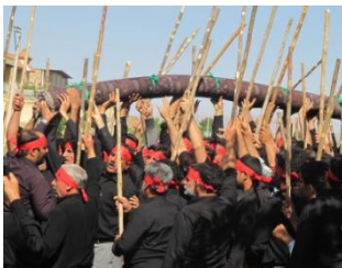
آیین قالی شویان مشهد اردهال، حمل قالی توسط چوب دستان فینی