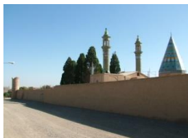
نمای گنبد و بارگاه شاهزاده ابراهیم کاشان