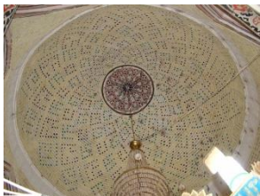
نمای آجرکاری سقف بقعه شاهزاده ابراهیم با طرح معقلی