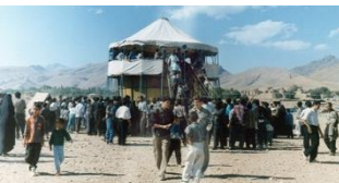
آداب جنبی آیین قالی شویان، معرکه گیری با دیوار مرگ