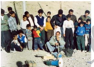
آداب جنبی آیین قالی شویان، معرکه گیری، نمایش مارگیر