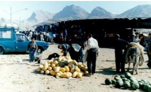
آداب جنبی آیین قالی شویان، بازارچه و دست فروش ها