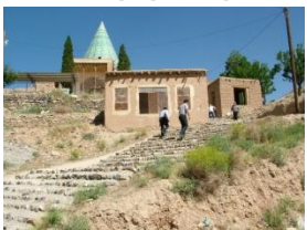
نمای کلی بقعه ی بابا افضل مرق

کاشان بدون آداب و رسوم نیست، رکن آداب و رسوم این زیارتگاه ها نیز دین و مذهب است. از نحوه زیارت امام زاده گرفته تا آیین های متوسل شدن، تحسن، نذر و نیاز کردن، قربانی کردن، حضور هیئات مذهبی در زیارتگاه برای برگزاری مراسم سوگواری و جشن و سرور و غیره، تمام این آداب با هدف ارتباط با خداوند است. مالرب در کتاب خود انسان و ادیان می گوید «نمازها، آواها، قربان کردن ها، پیشکش کردن ها، نذرو نیازها نشانه های دینداری و سرسپردگی دینی اند که راه پیمایی های گروهی، دسته راه اندازی و زیارت رفتن ها، گاه چند صد هزار دیدار را به دنبال خود می کشانند. پرستش یا فردی به کار بسته می شود یا گروهی، حال آن که آیین ها و مراسم از پیش نهاده شده اند، و به جا آوردن آن ها بر دیندار واجب است. پس می بینیم که دین ها به خود نمودن و خود بیرون ریختن نیاز دارد و آدمیان نیاز دارند آداب و مراسمی به جا آرند که برجسب های فرهنگی شان اند. روشی که ما آدمیان در آن آداب و مراسم به کار می بریم پیوسته نشان از خوی و عادت زمینی ما انسان ها دارد. به خداها عطر، خوردنی، یا حیوان پیشکش می کنیم بی آن که از خود پرسیم این ها در آن خدایان چه اندیشه ای بر می انگیزند.» (مالرب، ۱۳۸۳: ص ۲۶۶) بدیهی است تمام آداب و مراسم زیارتگاه ها رنگ و بوی مذهبی دارد که بر مجموعه ی عقاید و باور مردم استوار است. به تعبیر دیگر رفتارهای عبادی و آیینی که در آداب زیارتگاه ها رایج است چون از زمان های بسیار دور با فرهنگ مردم درآمیخته شده است، باید در فرهنگ و باورهای دینی مردم آن جامعه جستجو کرد