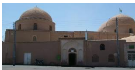
نمای کلی بقعه خواجه تاج الدین کاشان