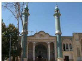
نمای کلی بقعه شاهزاده محمد اوسط، جوشقان استرک

موقعیت و محیط طبیعی بقعه شاه سواران واقع در ارتفاعات حومه قمصر، پیرداوود و پیرسلیمان قمصر، پیربادام روستای کلوخ، بقعه ی امام زاده یوسف روستای ون، امام زاده طاهر روستای خنب و.. که در مناطق کوهستانی و بیلاقی واقع اند ضمن داشتن جاذبه های مذهبی دارای پتانسیل های گردشگری طبیعی هم هستند. سخن و سرای سایر این گونه از بقعه ها و محوطه های پیرامون آن ها، در فصل تابستان های گرم و طاقت فرسای کاشان به تفرجگاه روزهای تعطیل تبدیل می شود. گردشگران این نوع زیارتگاه ها هم از اقلیم خوش آب و هوای منطقه استفاده می کنند و هم اعمال زیارت را به جا می آورند. اما پاره ای از گردشگران برای مطالعه و آشنایی با جاذبه هایی از قبیل آداب و رسوم، آیین ها، سنت ها، رفتارهای اجتماعی و... سفر می کنند که این جاذبه ها وجه اشتراک میان گردشگری مذهبی و گردشگری فرهنگی می باشند. هیچ زیارتگاهی در