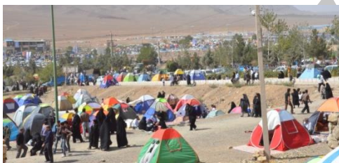
آیین قالی شویان، چادر، اقامتگاه موقت گردشگران