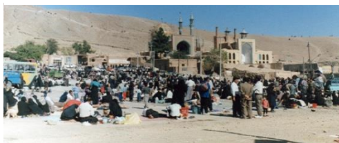
هفته بعد از جمعه ی قالی شویان، هفته نسلگی ها

چند صدسال پیش نسبت می دهند. همان طور که پیش تر گفته شد حضور و شرکت دست فروشان و دوره گردهای متعدد از شهرها و آبادی های مناطق مختلف استانی و فرااستانی در این بازارچه از جمله دست فروشان قمی، ساوه ای، دلیجانی و نراقی باعث شکل گیری گردشگری مبتنی بر کسب و کار شده است. علی بلوک باشی در «کتاب قالی شویان» بازار مشهد اردغال را محل ملاقات دوره ای بازرگانان و سوداگران و دست فروشان و مردمی که از شهر و دیارهای دور و نزدیک در آنجا گرد می آمده اند، تعریف کرده است. ایشان در ادامه آورده است «در این بازار صاحبان حرف مختلف کالاها و اجناس دست ساخت و مصنوع داخلی و خارجی و انواع خوراکی ها و تنقلات و آجیل ها را به مردم و زائران عرضه می کنند. در بازار هرگونه کالای باب طبع و سلیقه ی مردم فراهم بود. در آن از سنگ پای قزوین گرفته تا سوهان قم، از چاقوی نجف آبادی تا کلاهی کاشی، و از صابون آشتیان تا هل و گل یزد، از کاسه و کوزه سفالی قم و نطنز تا آفتابه لگن های مسی کاشان و تشت و ابریق پلاستیکی، اسباب و لوازم خانه و آشپزخانه، پارچه و قماش، لیف و کیسه و قطیفه ی حمام، خشکیبار و حلواجات و انواع گوناگون بیل و بیلچه و کلنگ و ابزار کشاورزی خلاصه از همه چیز از شیر مرغ گرفته تا جان آمیزاد فراهم بود» (بلوک باشی ۱۳۸۰: