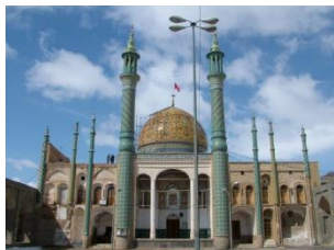
تزیینات معماری در گنبد و بارگاه بقعه سلطان علی ابن محمد باقر

افرادی که از این زنجیر وارد بقعه می شوند در پناه امامزاده قرار می گیرند. بقعه امامزاده حارث محلله درب زنجیر کاشان