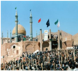
آیین قالی شویان مشهد اردهال، بقعه سلطان علی ابن محمد باقر (ع)

شماری از مورخان و نویسندگان قرن سیزدهم قمری از قبیل عبدالرحیم کلانتر ضرابی در کتاب تاریخ کاشان، محمدتقی بیگ ارباب در کتاب دارالایمان قم، حسن نراقی در کتاب آثار تاریخی کاشان، نطنز، با نظر و باور مردم این منطقه موافق هستند و