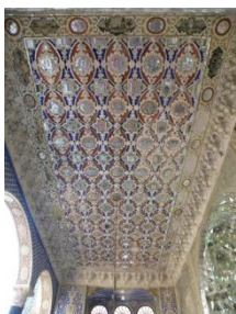
گچ بری و آینه کاری، نقاشی ایوان بقعه شاهزاده ابراهیم کاشان