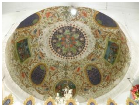
نقاشی سقف حرم بقعه شاهزاده ابراهیم

نمونه بارز زیارتگاهی است که به وفور افراد مجرم یا کسانی که از گیر حکومت فرار می کرده‌اند به این مکان پناهنده می شده‌اند. گفتنی است نام «درب زنجیری» که بر روی محل مانده از همان زنجیری گرفته شده که به در ورودی زیارتگاه آویخته بوده و حریم امامزاده را مشخص می کرده است. صورت دیگر بست نشینی در امامزاده ها به منظور حاجت طلبی است. افرادی که دچار بیماری سخت یا ناعلاج می شوند، یا شرایط زندگی بر آن ها سخت می شود، در امامزاده بست می نشینند و یا از بستگان نزدیک او مدتی در امامزاده در پای ضریح می نشینند تا حاجت خود را بگیرند. در گذشته موقعی که زائو دچار مشکل می شد و یا نمی توانست زایمان کند یکی از زنان فامیل او در کنار قبر امامزاده بست می نشست و یا لباس زائو را به ضریح می بستند تا زایمان بر او آسان شود.