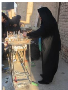
آیین چهل منبر، در شمع در زیارتگاه ها، امازاده غایب کاشان

زعفران و چای از حاضرین پذیرایی می کنند. بعضی شربت را که به دعا و نیایش لحظه ی سال تحویل متبرک شده برای تبرک به منزل می برند. همچنین در آستانه آغاز سال جدید زنانی که حاجت دارند در این زیارتگاه شمع روشن می کنند. مردم قمصر هنگام تحویل سال در بقعه ی پیرداود جمع می شوند، به قرائت قرآن و دعا و نیایش می پردازند، شربت گلاب یا بیدمشک درست می کنند، در میان جمع حاضر می گذارند تا به دعا متبرک شود. پس از تحویل سال شربت را می خورند یا به منزل می برند. گفته می شود در گذشته