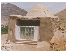
نمای کلی بقعه بی بی رقیه نسلک