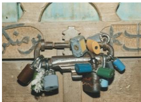
نمای کلی بقعه ی بابا افضل مرق

مردم روستای مرق موقع تحویل سال در زیارتگاه بابا افضل و اهالی روستای ارمک در بقعه ی شاهزاده محسن اجتماع می کنند و قبل از آغاز سال جدید دعا، قرآن و زیارتنامه می خوانند. برخی از اهالی که نذر دارند پس از تحویل سال با شربت