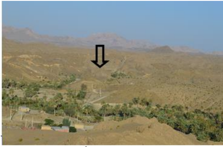
دورنمایی از کلات مارز، مأخذ: نگارنده، ۱۳۹۴.

استان کرمان با پیشینه‌ای کهن در جای جای آن منابع مختلف گردشگری، شامل جاذبه‌های طبیعی، فرهنگی و تاریخی گسترده شده است. یکی از این مکان‌ها دهستان مارز می‌باشد، که وجود کلات مارز (تصویر ۳) و تپه ای در مرکز دهستان (این قلعه) معروف به تپه سنگر (تصویر ۴) و هم چنین ده متروک شده بنگرو واقع در شمال شرقی دهستان مارز و روستاهایی هم چون درکلات، ناهوگان، کرچکان، نمگاز از دیگر مکان های گردشگری این دهستان هستند. اما در حال حاضر با توجه به نقش و اهمیت آن‌ها به نوعی مورد بهره‌برداری قرار نگرفته‌اند، و تاکنون در زمینه گردشگری و توسعه این دهستان هیچ برنامه صحیح و مدونی صورت نگرفته است.