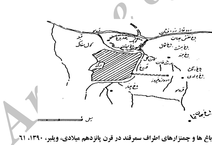
نقشه باغ‌ها و چمنزارهای اطراف سمرقند در قرن پانزدهم میلادی، ویلیبر، ۱۳۹۰، ۶۱

با توجه به موقعیت سمرقند و وجود انهار در اطراف این شهر برای مصارف زراعی و باغ‌کاری و داشتن پتانسیل بالای باغ‌سازی، طبیعی است که در آنجا، شاهد تنوع زیاد باغ‌ها با انواع درختان و میوه‌ها و گل‌ها باشیم. در احداث باغ‌ها روندی پیچیده دنبال می‌شد و این امر مانند احداث یک عمارت بود. بنابراین ساعت سعد و مختصات نجومی را، برای خوش‌یمن بودن آن به دقت محاسبه می‌کردند. در همین ارتباط استادکاران خبره‌ای لازم بود، که از همه سرزمین‌های تحت تصرف تیمور، مانند هند و آذربایجان و حتی سرزمین‌هایی که به تصرف او در نیامده بود، مانند چین فراخوانده می‌شدند (پتروچیولی، ۱۳۹۱، ۲۸۳-۲۸۴). تیمور در اطراف و نزدیکی سمرقند، به احداث حلقه‌ای از باغ‌های سلطنتی مبادرت ورزید. این تفرج‌گاه‌ها عبارت بودند از: «باغ شمال»، «باغ ارم»، «باغ بهشت»، «باغ دلگشا»، «باغ نو»، «باغ جهان‌نما»، «باغ دراز»، «باغ تخت قراچه» و «باغ قراتوپه». تیمور از بازماندگان بدویانی بود که دهه‌هایی از زندگی‌اش را به مجلل کردن و هرچه باشکوه‌تر کردن پایتختش سمرقند گذراند و کمربندی از باغ‌ها به وجود آورد و نام معروف شهرهای اسلامی از قبیل «قاهره»، «دمشق»، «بغداد»، «سلطانیه» و «شیراز» را بر آنها نهاد. این باغ‌ها، چون حلقه‌ای، شهر سمرقند را احاطه کرده بودند. (ویلیبر، ۱۳۹۰، ۵۷). (Golombek, ۲۰۰۶, ۱۴۰) و (جکسون و لاکهارت، ۱۳۹۰، ۱۱۹).