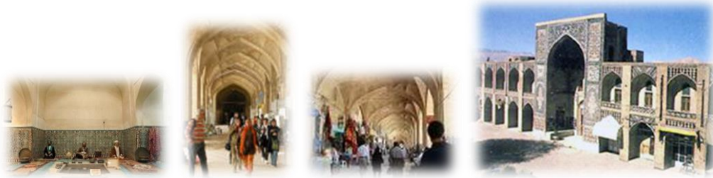
۱۰- مجموعه کنجلیخان :

این مجموعه مشتمل بر: میدان، حمام، آب انبار، کاروانسرا، مسجد، ضرابخانه و بازار است که در نوع خود کم نظیر و شاید بی نظیر است در هر یک از این بناها ظرافتی به کار رفته که خودارزشی جداگانه محسوب می شود. وجود سنگ نوشته سردر ورودی حمام، به خط میرعماد، و دو عدد سنگ صورتی رنگ در قسمت شرقی و غربی حمام که طلوع و غروب آفتاب را براب آگاهی نمازگزاران نشان می داده، همچنین وجود سربهایی که به دستور گنجلیخان، در کف آب انبار بکار رفته بود تا در تابستان آب خنگ بماند و... از جمله ارزشهای این مجموعه به شمار می رود.