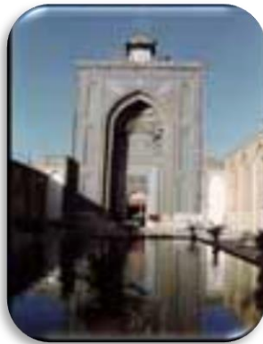
۶- مسجد جامع :

یکی از زیباترین مساجد ایران است که دارای سردر رفیع، صحن، ایوان و شبستان می باشد. این مسجد در دوران حکومت امیر مبارزالدین محمد مظفر سر سلسله آل مظفر بنا گردیده است و تاریخ آن به موجب کتیبه سردر شرقی، ۷۵۰ هجری قمری است ارزشمندترین قسمت بنا، کاشیکاری معرق محراب و سردر شرقی مسجد است.