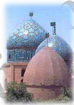
گنبد مشتاقیه (سه گنبد)

یکی از زیباترین مساجد ایران است که دارای سردر رفیع، صحن، ایوان و شبستان می باشد. این مسجد در دوران حکومت امیر مبارزالدین محمد مظفر سر سلسله آل مظفر بنا گردیده است و تاریخ آن به موجب کتیبه سردر شرقی، ۷۵۰ هجری قمری است ارزشمندترین قسمت بنا، کاشیکاری معرق محراب و سردر شرقی مسجد است.