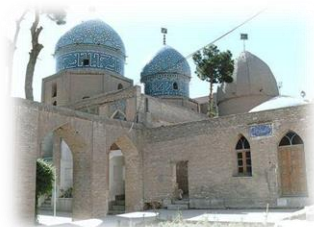
آرامگاه مشتاق علیشاه

گنبد مشتاقیه که به سه گنبد نیز شهرت دارد، از آثار دوران قاجار در شهر کرمان است که در گذشته در جوار قبرستان کهنه و خارج از حصار شهر قرار داشته است. این محوطه ابتدا مزار میرزا حسین خان جد اعلا سادات معروف به میرحسینی کرمانی بوده است. مشتاق در سال ۱۲۰۶ هجری قمری به جرم آن که قرآن را با نوای سه‌تار می‌خواند، سنگسار شد و جسد او را در کنار مقبره میرزا حسین خان دفن کردند که اینک این مزار معروف به مشتاقیه است. سه گنبد در سال ۱۲۶۰ قمری بر روی قبور مشتاق علیشاه، شیخ اسماعیل و کوثر علیشاه بنا گردید. آثار تزئینی مجموعه مشتاقیه که در قرن اخیر ساخته شده است شامل کاشی‌کاری، نقاشی، گچبری، کاربندی و مقرنس می‌باشد.