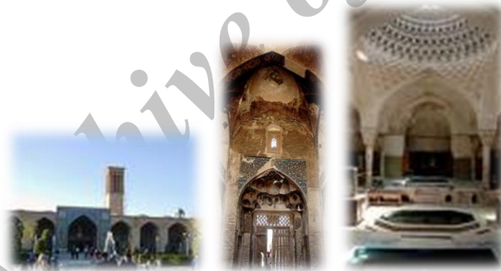
۱۱- مجموعه ابراهیم خان :

بانی مجموعه، ابراهیم خان ظهیرالدوله از حاکمان دوران پادشاهی فتعلی شاه است. این مجموعه از بازار، حمام، آب انبار، مدرسه و خانه مدرس یا خلوت، تشکیل گردیده و در ساخت آن تا حدود زیادی از فضاهای معماری صفویه الهام گرفته شده و هم اکنون به عنوان یکی از ارزشمندترین مجموعه ها و زیباترین آثار تاریخی کرمان محسوب می شود.