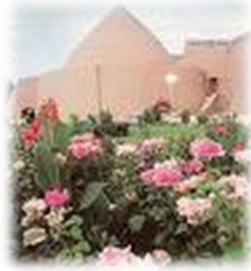
آتشکده و موزه زرتشتیان کرمان