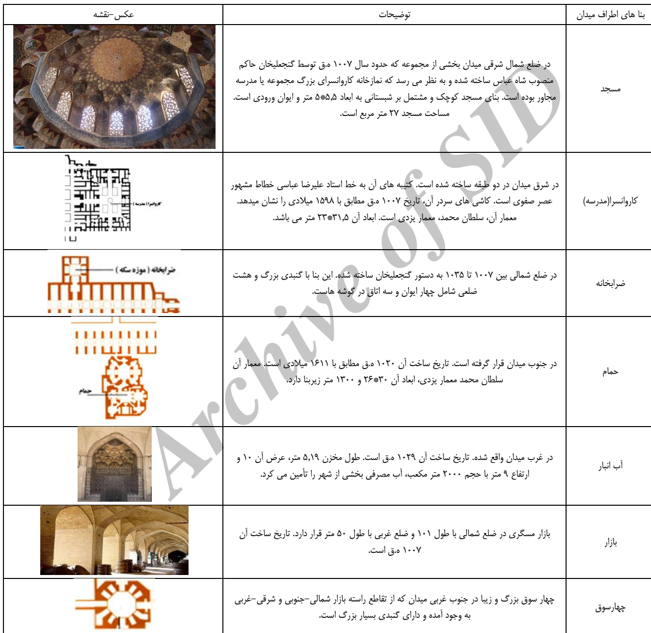
جدول ۱. عناصر میدان گنجعلیخان

میدان گنجعلیخان از جمله میادین بسته ای است که گرداگردش را بناهایی متفاوت محصور کرده است. زمان ساخت این میدان اوایل قرن یازدهم هجری (۱۷ میلادی) است. این میدان و مجموعه اطراف آن در دوره صفویه و در زمان حکمرانی گنجعلیخان بر کرمان و طبق دستور شاه عباس اول صفوی بنا گردید. گنجعلیخان با انتخاب بخشی از بازار که در محل تقاطع راسته بازارهای