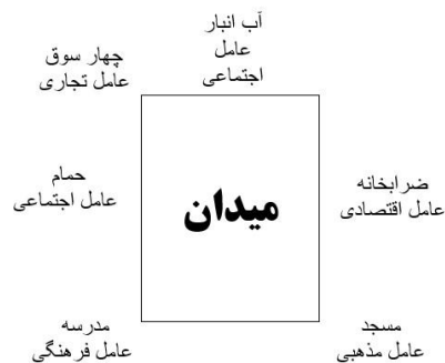
شکل ۲. عناصر میدان و عوامل اجتماعی، اقتصادی، تجاری، فرهنگی و مذهبی