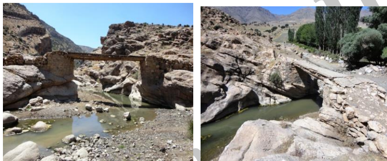
تصویر ۱: نمای شرقی پل تنگی و نمای روی پل جهت جنوب به شمال

این پل در یک کیلومتری شمال شرقی روستای تنگی و واقع در دهانه دره ای که منتهی می شود به کتیبه آشوری، در ۵۰۰ متری جنوب آن و بر روی رودخانه تنگی و احداث گردیده است. این پل دارای یک دهانه است و پایه های پل در دو طرف متکی بر صخره های طبیعی هستند و ستون ها که از قلوه سنگ می باشند بصورت نیم دایره ای بر روی این تخته سنگ ها قرار دارند. پل در تنگ ترین دهانه رودخانه بر روی دو تخته سنگ بسیار بزرگ طراحی شده است. در جهت پل به سمت کتیبه باستانی یک مسیر سنگ چین به چشم می خورد. پل فاقد جان پناه و مال رو می باشد. مصالح بکار رفته سنگ برای پایه ها، چوب که از تنه درختان منطقه می باشد روی پل و ملات ساروج در رج های پایینی سنگ چین پایه ها به چشم می خورد. پل در حال حاضر سالم و مورد استفاده مردم منطقه است. با توجه به نیاز مردم منطقه و عبور و مرور از روی آن احتمالاً توسط اهالی روستا این پل مرمت شده و در حال حاضر ملات سیمان برای پایه های سنگی استفاده شده همچنین سطح پل نیز با ماسه و سیمان مفروش است (تصویر ۱). این پل احتمالاً از دوران باستان مورد استفاده بوده و همواره با توجه به نیاز مردم منطقه مورد بازسازی قرار گرفته است.