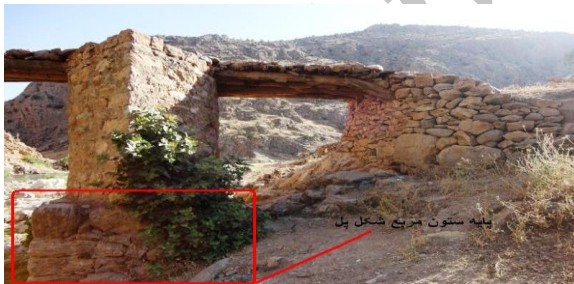
پایه ستون مربع شکل پل

این پل نرسیده به روستای پالنگان در شرق روستا احداث گردیده و به پل دوآو (دو آب) معروف است. این پل دارای ۴ دهانه که یکی از آنها از سایر دهانه ها کوچکتر است. پل بر روی سه پایه ستون و دو پایه تکیه گاهی ساخته شده، دهانه ها فاقد طاق بوده و پایه ها (ستون ها) بصورت یک تکه تا قسمت بالای پل، بنا گردیده اند (تصویر ۳). از نظر معماری این پل شاخص ترین پل در میان پل های باقی مانده منطقه است زیرا بقایای معماری قبلی پل در پایه های آن کاملاً موجود می باشد (تصویر ۵). در پایه دوم پل از سمت راست پایه قدیمی افتاده و از آن به عنوان پشت بند و پایه برای پایه جدید استفاده شده است (تصویر ۳). همچنین در پایه اول از سمت چپ این پل پایه ستون مربع شکلی مشابه پایه های باقی مانده در پل شماره ۱ (پل دختر) می باشد. موج شکن ها در جهت جریان آب بصورت مثلثی می باشند. در ساخت پل از قلوه سنگ با ملات ماسه آهک برای ستون ها و پایه های پل استفاده شده است.