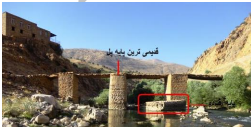
قدیمی ترین پایه پل