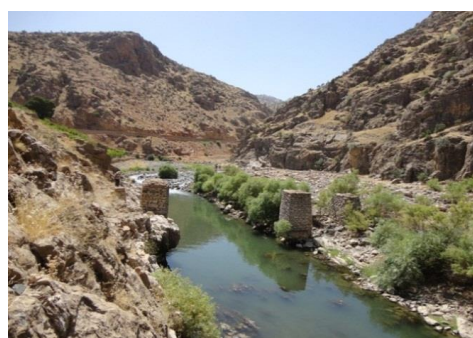
تصویر ۷: پل شماره ۳ دید از شمال به جنوب