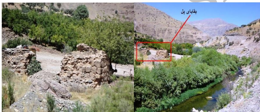
تصویر ۶: بقایای پل دختر پالنگان دید از غرب به شرق

پل در فاصله حدوداً یک کیلومتری شمال شرق روستای پالنگان قرار دارد. از این پل فقط دو پایه ستون باقی مانده است. پایه ستون های باقی مانده از این پل مربع شکل می باشند ابعاد پایه بزرگتر ۲*۲ و ارتفاع آنها نیز ۲ متر است این پایه ها و بزرگی آنها نشان از عظمت و اهمیت سازه ای که روی آن قرار داشته می باشد. مصالح بکار رفته در این پایه ها قلوه سنگ و ملات ماسه آهک است (تصویر ۶). پایه ستونهای مربع شکل و بسیار بزرگ این پل نشان می دهد این اثر یکی از پل های مهم منطقه بوده، سبک پایه ستون های باقی مانده این پل که مربع شکل هستند همچنین نام این پل که به گفته اهالی منطقه به پل دختر معروف بوده نشان دهنده قدمت پل است و احتمالاً این پل در دوره تاریخی احداث گردیده تا اواسط دوره اسلامی مورد استفاده بوده است. از این نمونه پایه پل در منطقه لرستان مشاهده و می تواند با این پایه قابل مقایسه باشد.