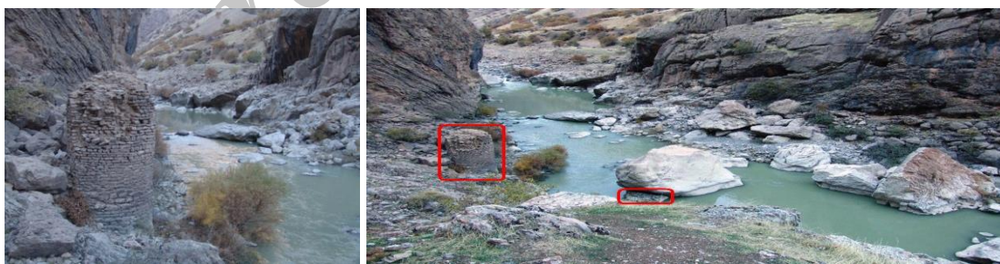
تصویر ۹: آثار پل بلبر دید از شرق به غرب

پل در شمال روستای بلبر قرار دارد. از این پل فقط یک ستون باقی مانده و مقداری بقایای پایه ای که افتاده و احتمالاً در اثر ریزش سنگ بر روی پل تخریب شده. ارتفاع آنها حدوداً ۶ متر، ستون باقی مانده از این پل مدور و موج شکن در جهت جریان آب مثلثی شکل می باشد. مصالح بکار رفته در این ستون قلوه سنگ و ملات ماسه آهک(ساروج) است. از پل فقط پایه ی آن باقی مانده که در صورت عدم مرمت و نگهداری در اثر سیل آبهای فصل بهار با تخریب مواجه می گردد و از بین می رود(تصویر ۹). با توجه به نوع معماری، سبک ساخت، مسیر حرکتی و مصالح بکار رفته که در بقایای این پل مشاهده گردید همدوره با سایر پل های منطقه بوده و مربوط به دوره تاریخی می باشد.