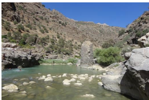
تصویر ۸: نمای روبروی پایه پل سلین دید از غرب به شرق

پل درفاصله ۱۰۰۰ متری شمال روستای سلین قرار دارد. از این پل فقط یک ستون باقی مانده است. ارتفاع آنها حدوداً ۷ متر، ستون باقی مانده از این پل مدور و موج شکن در جهت جریان آب مثلثی شکل می باشد. مصالح بکار رفته در این ستون قلوه سنگ و ملات ماسه آهک(ساروج) است. از پل فقط پایه ی آن باقی مانده که در صورت عدم مرمت و نگهداری در اثر سیل آبهای فصل بهار با تخریب مواجه می گردد و از بین می رود(تصویر ۸). با توجه به نوع معماری، سبک ساخت و مصالح بکار رفته که در بقایای این پل مشاهده گردید همدوره با سایر پل های منطقه بوده و مربوط به دوره تاریخی می باشد.