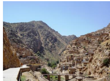
تصویر ۲: پل داخل روستای پالنگان (مأخذ: نگارندگان، ۱۳۹۳) تصویر ۳: پایه ستون مربع شکل ستون اول سمت چپ پل دید از غرب به شرق (مأخذ: نگارندگان، ۱۳۹۳)