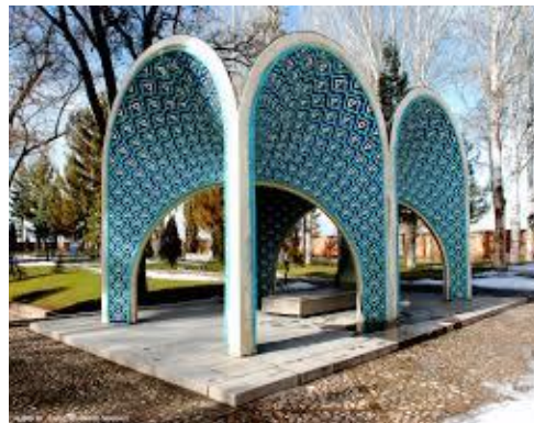
شکل (۴) آرامگاه کمال الملک نقاش معاصر ایران