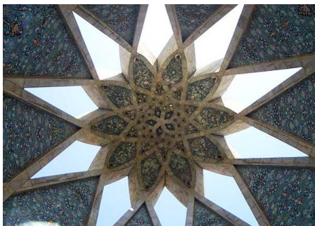
شکل (۳) شمسه در سقف آرامگاه حکیم عمر خیام