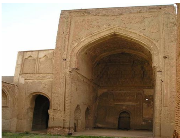
تصویر ۲- نمای ایوان جنوبی، مسجد جامع

خوردگی شده، مسدود گردیده است. در حال حاضر دوتا از این درگاه‌ها باز است و به‌عنوان درگاه ارتباطی با فضاهای جانبی ایوان اصلی استفاده می‌شود. وضع کنونی مسجد نشان می‌دهد که شکاف‌هایی عریض و حتی جابه‌جا شدن‌های چشمگیری در آن اتفاق افتاده است. در حین مرمت‌های مسجد، یکی از درگاه‌ها را که در آن محرابی گچبری شده قرار دارد، باز نموده‌اند [۴].