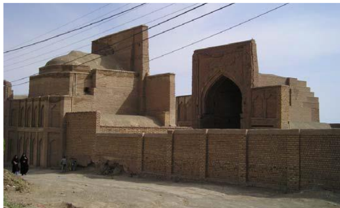
تصویر ۱- نمای عمومی مسجد فرومد (نگارنده)

این مسجد متشکل از دو ایوان شمالی و جنوبی است که محور تقارن آن‌ها برهم منطبق نیست. دو ایوانچه دو طرف ایوان‌ها و نیز شبستانی در ضلع شرقی ایوان جنوبی و نیز احتمالاً شبستانی به قرینه در ضلع غربی همین ایوان، دو رشته رواق در طرفین صحن و نیز یک طاق گنبد دار چهار گوش، در ضلع غربی ایوان شمالی می‌باشد [۴].