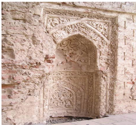
تصویر ۳- محراب کوچک داخل پایه دیوار ایوان اصلی (نگارنده).

ب- محراب اصلی مسجد: این محراب که در انتهای ایوان جنوبی ساخته شده است، محراب بزرگ و زیبایی است. ارتفاع محراب تا پیشانی قوس ۷۰۷ سانتی‌متر و عرض ۴۳۰ سانتی‌متر و عمق ۹۰ سانتی‌متر است. محراب، مستطیل شکل است که در دو سوی پیشانی آن، دو فرم گلدانی کار شده قرار دارد و دارای یک طاق‌نما با قوس تیزه‌دار است که دو ستون با سرستون‌های گلدانی شکل در دو طرف پایه‌های آن قرار دارد. زمینه نقوش و طرح‌ها با رنگ لاجوردی و آبی رنگ‌آمیزی شده است. طرح‌هایی که در تزئینات آن به کار رفته منحصر به فرد است. در انتهای کتیبه محراب، سال ساخت را مشخص کرده ولی واژه‌های ".... فی شهر" از آن باقی‌مانده است. در نتیجه گذار آن را مربوط به قرن ششم هجری می‌داند [۴]. هر چند که ویژگی خاص محراب‌های زمان ایلخانی را داراست و بسیار مزین و پرکار با تزئینات گچ‌بری و کتیبه‌نگاری ساخته شده، اما محراب به صورت برجسته‌تر از سایر محراب‌های دوره ایلخانی است [۴]. بر روی پیشانی قوس محراب، کتیبه‌ای به خط کوفی مقعد، گچ‌بری شده است. این کتیبه بر اثر عوامل طبیعی و انسانی آسیب دیده است. فقط واژه‌های "محمد" و "جامع" از آن خوانده می‌شود [۴].