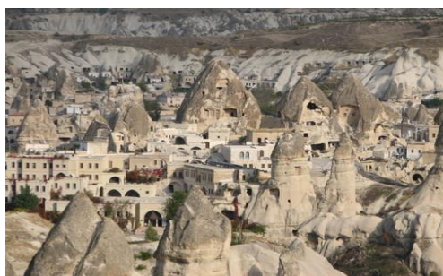
شکل ۲- روستای کندوان (تناسب ساختار کالبدی روستا با محیط پیرامون)

«هماهنگی با ساختگاه» از مفاهیمی دیگری است که معماری پایدار را با اصل «مردم واری» معماری بومی این سرزمین پیوند می‌دهد، چرا که سنخیت داشتن با محیط پیرامونی و هماهنگی با ساختگاه (شکل ۱،۲) و رعایت وجه کیفی مفهوم تناسب معماری معنا می‌یابد و بدین‌سان کمترین میزان مداخله در ساختار طبیعی محیط را باعث می‌گردد. این طبیعت است که فرم و شکل معماری را تعریف نموده و به آن تشخص می‌بخشد. بنا بواسطه این تبعیت، کمترین میزان تغییر را در شکل زمین ایجاد می‌نماید و چنان شکل می‌گیرد که گویی بخشی از طبیعت محیط پیرامونی است [۱۰].