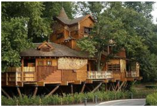
شکل ۵: استفاده از مصالح بوم آورد در معماری پایدار نوین

سازگارتر می‌شود و هم در تعمیر بنا، ساخت مایه‌هایش همیشه در دسترس است. از نمونه‌های خوبسندگی، استفاده از خاک حاصل از خاک‌برداری برای خشت زدن و ساختن همان بناست [۸]. خودبسندگی متضمن معنایی بومی از چیزی است که در روزگار ما در جریان معماری پایدار ظهور کرده است. خودبسندگی به مفهوم استفاده از مصالح بوم‌آورد، «استفاده از مصالح طبیعی» و «استفاده از مصالح قابل بازیافت» است. خود بسندگی اصلی است که استفاده از مصالح طبیعی و بوم آورد را به خالق بنا القاء می‌نمود. این رکن معماری سنتی، عامل هم پیوندی اثر با زیست بوم و طبیعت پیرامونی بود و حداکثر صرفه جویی در هدر رفتن انرژی جهت انتقال مصالح را به همراه داشت. امروزه نیز استفاده از مصالح طبیعی منطقه به جهت حفظ ساختار طبیعی اثر و محیط پیرامونی و کاهش مصرف انرژی ناشی از حمل مصالح از نقطه‌ای به نقطه دیگر و به تبع آن کاهش آلودگی‌های زیست محیطی، بعنوان یکی از مفاهیم اصلی معماری پایدار، مورد تاکید است [۱۵] (شکل ۴ و ۵).