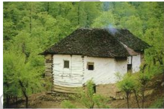
شکل ۴: نمود خود بسندگی در معماری بومی منطقه