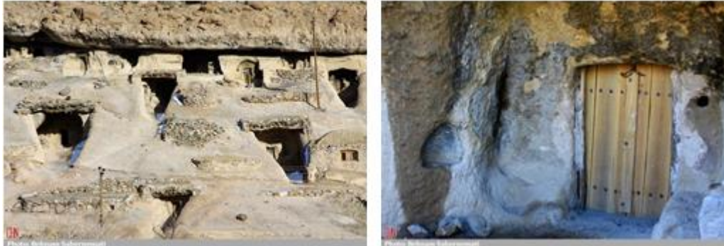
شکل 4- نمونه روستای میمند، ماخذ: www.jamejamonline

جهت ایجاد فضاهای سکونتی در بهترین جای ممکن استقرار یافته است