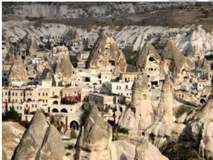
شکل 3- نمونه روستای کندوان، ماخذ: www.jamejamonline

دهکده توریستی و تاریخی کندوان، در دامنه‌های سرسبز کوهستان سهند، در دنباله دره ویدهر اسکوچای به طرف ارتفاعات سهند، در سمت راست آن قرار گرفته و از نظر تقسیمات کشوری تابع شهرستان اسکو است. این روستای بی نظیر و تاریخی، با معماری بی نظیر طبیعی، معماری صخره‌ای و وجود آب معدنی گوارای با خاصیت درمانی از شهرت و آوازه جهانی برخوردار است [12]. این دهکده مثال زنده‌ای است از یک نوع تلفیق و ترکیب فرمها و تناسبات بدیع که از قرن‌ها پیش، انسان زندگی خود را به بهترین وجه با آن منطبق کرده است. در این محیط عوامل کالبدی محیط زیست انسان از بین عوامل کاملاً طبیعی انتخاب شده است. به این معنی که انسان طبیعت را مهار و در آن رسوخ کرده و از سوی دیگر، طبیعت رفتار او را تحت تأثیر خود قرار داده است و تکامل این ترکیب در دگرگونی هر دو موثر بوده است [13].