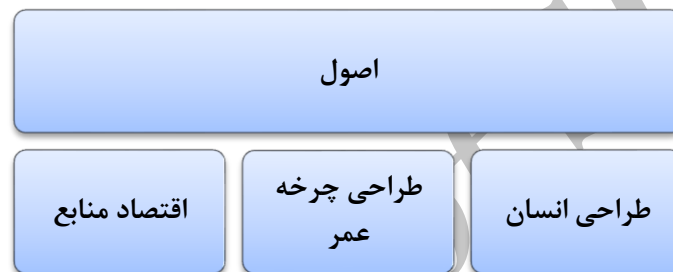
شکل 2- نمونه دیاگرام اصول طراحی پایدار، ماخذ: علی‌نقی‌زاده 1392

پایداری هر سه سامانه اقتصادی، فرهنگی-اجتماعی و محیطی، خط بنیان سه‌گانه نامیده می‌شود که توسط آن دوام و موفقیت توسعه و طراحی، ارزیابی می‌گردد [3]. تبیین رابطه متعادل‌تر و هم‌زیستانه اثر معماری با محیط که بر کنش-مندی خودآگاه اثر معماری نسبت به شرایط محیطی پی‌ریزی شده است. توسعه پایدار شهری و پایداری اجتماعی شهری، مستلزم اقتصاد پایدار شهری، محیط زیست پایدار شهری، زندگی پایدار شهری و سایر ابعاد پایداری می‌باشد که در مجموع از آن به عنوان برابری درون نسلی و اصل نسل آینده یاد می‌کنند [7].