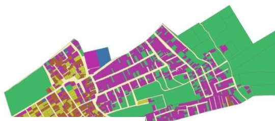
نقشه شماره ۲: قدمت بنا در شهرک مهدی آباد

همان گون که در نقشه نیز قابل مشاهده است ۵۱٪ ساختمانهای موجود در سطح محدوده دارای سازه آجر می باشند بنابراین می توان چنین نتیجه گرفت که بافت مذکور فاقد استحکام بنا می باشد. همان گون که در نقشه نیز قابل مشاهده است ۳۷٪ ساختمانهای موجود در سطح محدوده قابل نگهداری می باشند بنابراین می توان چنین نتیجه گرفت که بافت مذکور نیاز به تقویت و بهسازی دارد.