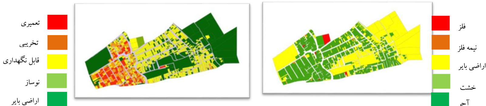
نقشه شماره ۴: کیفیت بنا در شهرک مهدی آباد