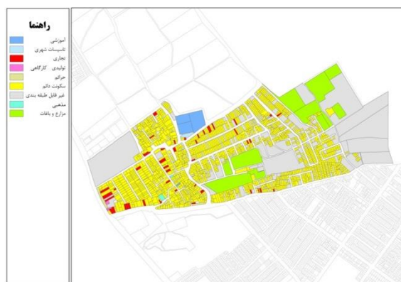
نقشه شماره ۵: کاربری وضع موجود در شهرک مهدی آباد

آباد همچنان به روند سکونتگاهی شهرک از طریق ایجاد ساختمانهای مسکونی نوساز علاقه نشان می‌دهند و پراکندگی قابل توجه کارکردهای صنعتی در حاشیه محور توس در قالب صنایع کارگاهی کوچک نوعی ناسازگاری قابل توجه کارکرد مسکونی با کارکرد صنعتی را رقم می‌زند.