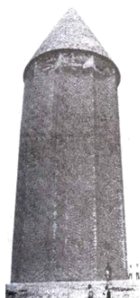
شکل ۱- گنبد قابوس، مقبره قابوس بن وشمگیر، ماخذ: (از کتاب «معماری اسلامی» تالیف روبرت هیلن براند)