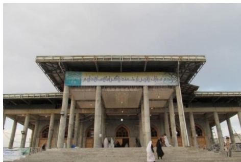
شکل 3- بخش الحاقی به بقعه‌ی خواهر امام

ساغریسازان که بخشی از محله زاهدان است، محل سکونت اشخاص متمول شهر بوده و به‌زعم بسیاری از پژوهشگران تاریخ، این محله به دلیل تجمع سکونتی خانوارهای سرشناس، دارای اعتبار زیادی در کل بافت شهر بوده است. چنانکه در کل، درباره بافت شهری رشت بیان می‌شود "محلات رشت به سبب کیفیت احوال شخصیه‌ی ساکنانش اعتبار داشت. مثل محله‌ی ساغریسازان که جمعی از خانواده‌های ریشه‌دار و متعین در آن سکنی داشتند" [5]. این محله دارای 6 بنای مذهبی مهم با حوزه‌ی عملکردی ناحیه‌ای و شهری است.