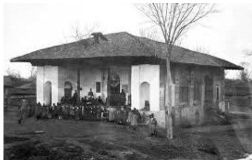
شکل 1- عکس قدیمی بقعه‌ی خواهر امام [8] شکل 2- تغییرات بقعه