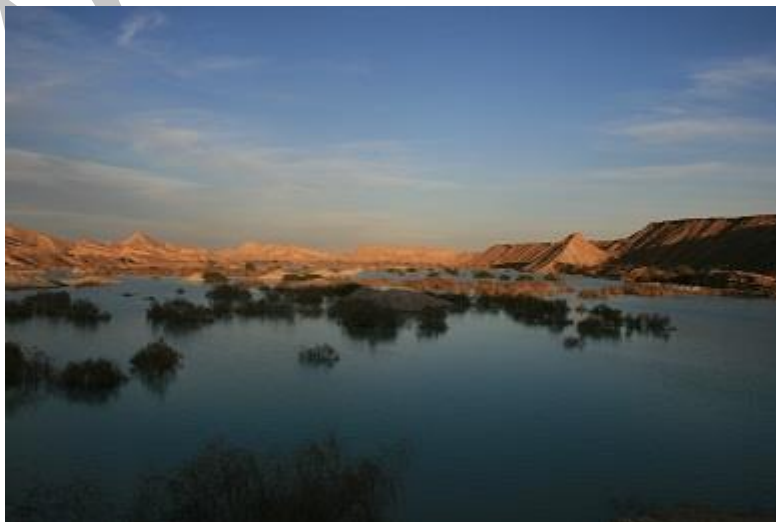
شکل ۲. سد خالصی

۲. سد خالصی، بزرگترین سد جزیره قشم در نزدیکی روستای دیرستان که هر ساله در فصل زمستان و بهار گردشگران زیادی را به خود جذب می کند ( شکل ۳).