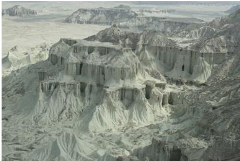
شکل ۱. کوه بصیرا

۱ . کوه بصیرا در فاصله ۱۱۰ کیلومتری شهر قشم واقع شده است که دارای مناظر زیبا و منحصر به فرد می باشد ( شکل ۱).