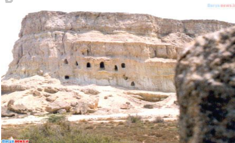
شکل ۵. غارهای خریس

۵. غارهای خریس، در ۱۷ کیلومتری شهر قشم کنار ساحل جنوبی ( شکل ۵).