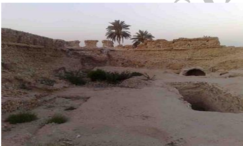
شکل ۴. قلعه پرتغالی ها

۴. قلعه پرتغالی ها، واقع در شهر قشم محله مسنی کنار ساحل شرقی قشم ( شکل ۴).