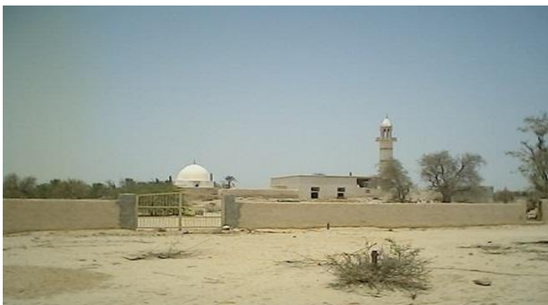
شکل ۶. مسجد شیخ برخ

۶. مسجد شیخ برخ، قدیمی ترین مسجد جزیره قشم در قرون اولیه اسلام در روستای کوشه ( شکل ۶).