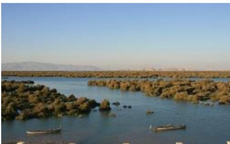
شکل ۳. جنگل حرا

۳. جنگل حرا، یکی از پدیده های نادر جهان که در ساحل شمالی جزیره قشم روستای طول (طبل) واقع شده است ( شکل ۳).