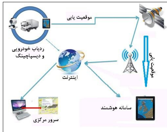
شکل شماره 3: فلوچارت سیستم یکپارچه

از مزایای استفاده از این تکنولوژی به جای ردیاب خودرویی میتوان به یکپارچه سازی هزینههای سخت افزاری (مانیتور، گیرنده GPS، فرستنده، دوربین و...)، قابلیت ارتقاء بالای سخت افزار با پیشرفت تکنولوژی، قابلیت ارتقاء بسیار بالای نرم افزار، امکان توسعه نرم افزار بر روی سیستم عاملهای مختلف و امکان بست و توسعه آن در هر برهه زمانی و بر حسب نیاز، کاهش هزینههای قابل توجه سخت افزار و نرم افزار، امکان استفاده و پیاده سازی مانیتورینگ بر روی هر یک از انواع وسایل نقلیه موتوری و حتی پرسنل و نیروهای پیاده viii بدون تغییر و استفاده از انواع GPSهای سخت افزاری مختلف برای هر کارکرد، ثبت و ضبط اطلاعات متنوع مانند دیتا، عکس، فیلم، صدا و...، قابلیت ایجاد و رابطه متقابل دو طرفه (خودرو با مرکز و بالعکس) با امکانات بسیار بالا مانند متن، صدا، تصویر حتی بر بستر VOIP اشاره کرد.