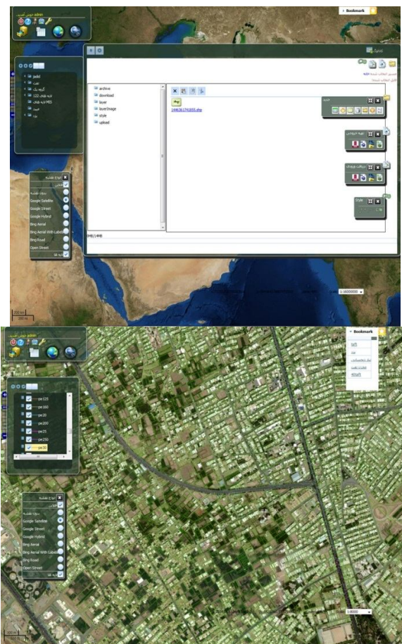
اشکال شماره 1: سامانه وب GIS در ابفای استان یزد