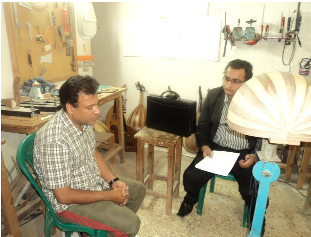
محقق در حال مصاحبه با