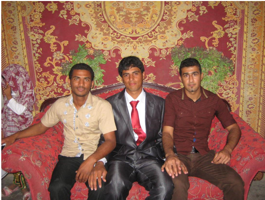
عکس هایی از ساز جفتی