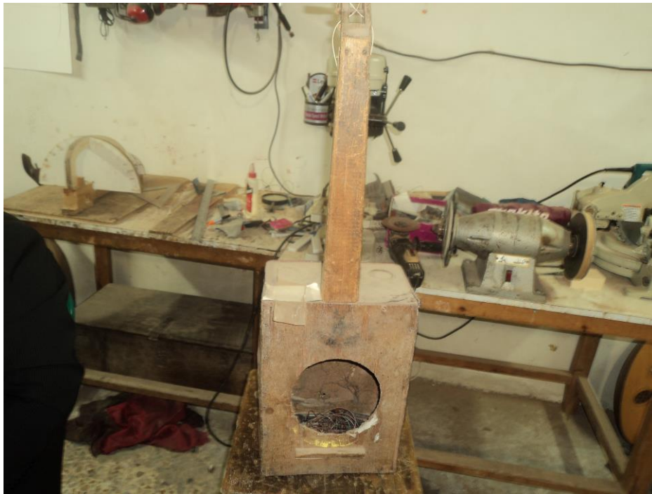
اولین عود ساخته شده توسط استاد اشعری در سال ۱۳۶۴