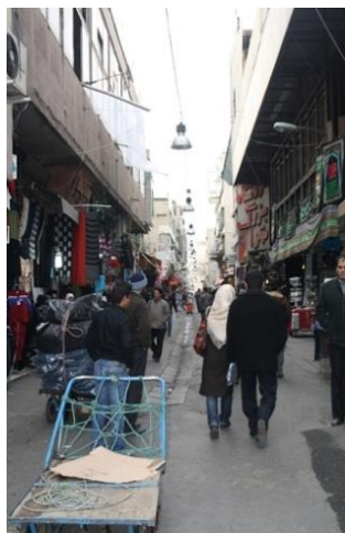
کوچه برلن

اضافه کردن الحاقات به ساختمان، کانال کشی و نصب کولر در مقابل پنجره ها و نمای ساختمان و سیم کشی نامناسب از عوامل اغتشاش سیمای جداره ها در محدوده هستند. عدم وجود نظم در