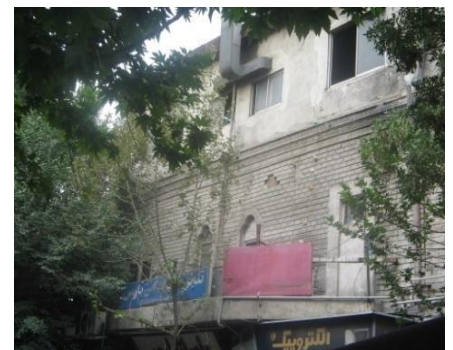
سینما ایران

رنگ تعلق از سه عامل تاثیر می‌پذیرد: نحوه تصرف و مالکیت، گونه ساختمان و فناوری ساخت. از مجموع این سه عامل به علت اینکه نحوه تصرف زمین‌های این محدوده قانونی و معتبر بوده است و مالکیت شخصی در سراسر محور حاکم است امکان بالقوه برای مردم برای دمیدن روح به فضا وجود دارد، اما به علت کاربری مسکونی کمتر محیط و عدم حضور دایمی ساکنین در محدوده، کمتر رنگ و بوی تعلق در فضا نمایان است. در زمینه گونه ساختمان‌ها کمتر ملکی را می‌توان یافت که یک مالک داشته باشد از این رو هماهنگی آنها برای شخصی‌سازی محیط بسیار سخت است.