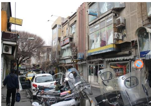
کوچه مهران

کرمونا موضوعات پایه در خصوص مفاهیم واحد همسایگی را شامل اندازه، مرزها، معنا و ارتباط اجتماعی و اختلاط اجتماعی و جوامع متعادل معرفی کرده است که در زیر به بررسی آنها در محدوده لاله زار پرداخته شده است.