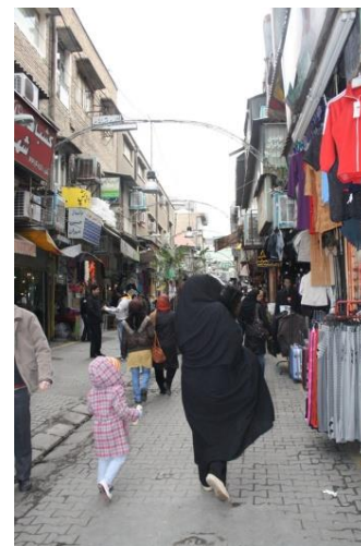
کوچه رفاهی

به طور کلی محدوده بافت مرکزی تهران و به تبع آن لاله زار محدوده ای یکپارچه و متعادل نیست و نمی توان آن را به عنوان یک کل یکپارچه درک کرد و در محدوده لاله زار قشرهای گوناگونی از مردم همزمان با هم حضور دارند و به کار و فعالیت مشغولند به همین دلیل نمی توان محدوده را به گروه یا طبقه خاصی نسبت داد با این حال به دلیل اینکه عمده فعالیت های محدوده به کالاهای الکتریکی اختصاص دارد از لحاظ عملکردی قابل جداسازی از بافت اطراف خود هست. به دلیل اینکه محور لاله زار یک محور با وجه ی تجارتي قوی است و فروشندگان و خریداران، دو گروهی هستند که چهره غالب رفتاری محور را تشکیل می دهند و در کنار کارکنان تولید، رانندگان، کلیت الگوی رفتاری در محور را می سازند.