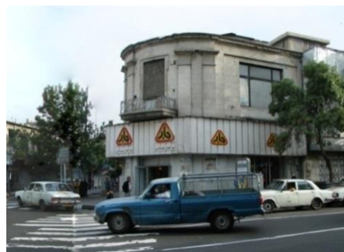
سینما تابان

در مورد معلولین می توان گفت بیشتر ساختمانها، قابل دسترس برای افراد روی صندلی چرخ دار نیستند. مخصوصاً تمهیدات اندیشیده شده به منظور جلوگیری از ورود خودرو به درون کوچه های پیاده متاسفانه ورود افراد معلول را نیز مشکل مواجه کرده است و همچنین وجود تابلوهای چشمک زن که تقریباً در تمام سکانسها قابل رویت است، بیماران صرعی را با خطر حمله عصبی مواجه می کند البته این مشکل در روز چندان خودنمایی نمی کند.