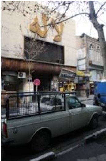
سینما لاله

محور لاله زار به عنوان یک محدوده خاص شهری مراجعان بسیاری دارد که نوعی تحرک و پویایی شهری را در این مکان به وجود می آورند. بدیهیست که تعاملات اجتماعی را در رابطه بین پیاده ها می توان جستجو کرد و رابطه بین سواره ها تقریباً بی معنی است، مطلوبیت حرکت پیاده در این فضاها که باید هم پاسخگوی حضور افراد باشند و هم عبور آنها را تامین کنند بسیار ضروری است، اما