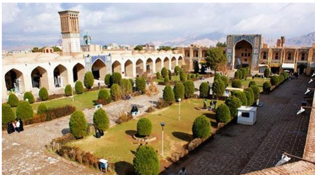
میدان گنجعلیخان کرمان

۱- استفاده از ترکیب نیازهای میادین شهری با معماری با روح و درگیر با محیط زیست ، استفاده از دسترسی‌های مناسب ، رنگ ها ، مصالح ، اشکال هندسی و عناصر اقلیمی مناسب