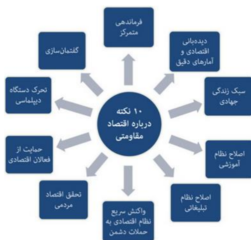
شکل (۱): نکات اقتصاد مقاومتی ( www.khamenei.ir )