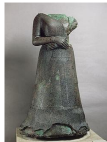
تصویر ۳، پیکره شهبانو ناپیراسو، همسر اونتاشگال پادشاه ایلامی در هنر تمدن ایلام