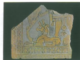
تصویر ۶، قطعه‌ای از یک کاشی لعابدار در هنر تمدن ایلام، (مجیدزاده، ۱۳۸۶)

در توصیف تصویر ۵، روش بنای «زیگورات»، که خاص ایلام می‌باشد، این بنا، عبارت از برجی پله‌دار بوده که از پایین به بالا، از حجم آن کاسته می‌شده و در طبقه بالا معبد این شوشیناک خدای خدایان قرار داشته‌اند و جایگاه خدایان نامیده می‌شده، و در طبقات دیگر خدایان قرار داشته‌اند. این بنا مجموعه‌ای از هنر معماری نقاشی و لعابکاری زمان است، که اوج هنر ایلام را نشان می‌دهد. در تحلیل تصویر ۵، میتوان گفت این بنا پرستشگاهی برای خدایان و الهگان تمدن ایلام بوده است، به نظر می‌رسد نقوش پلکانی گویی عروج انسان را نشان می‌دهند. انسان با احترام و پرستش همچون پله‌ها، به صورت طبقه بندی مقام‌های خدایان، رفته رفته به بندگی خدای خدایان می‌رسیده است.