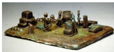
تصویر ۴، صحنه برآمدن خورشید در هنر تمدن ایلام

در توصیف تصویر ۴، که از شاخه های درختان آشکار است، سکو، پله و کوزه به چشم می خورد. در میان همه این عناصر دو مرد برهنه که یکی از آن ها نیمه نشسته می بشد گویی بر روی دست مد دیگ آب می ریزد. گویی مراسم آیینی خاصی باشد. این اثر که به زبان اکدی « طلوع خورشید» می باشد، ممکن است این مراسم در بآمدن خورشید انجام می شده است. در تحلیل تصویر ۴، به نظر می رسد صحنه آیینی را در هنگام برآمدن خورشید در حال انجام آن می باشند. ممکن است مردی که به حالت کامل نشسته کاهنی باشد و بر روی دستان مدی که از لحاظ جایگاه از او در مقام بالاتری قرار دارد، آب می ریزد. بطور احتمال برهنگی جزئی از اعمال آیینی برنامه مذهبی شان بوده است. این اثر ماکتی از صحنه بر آمدن خورشید در هنر تمدن ایلام می باشد، به طوریکه بیننده با دیدن آن، تا حدودی می تواند روند اجرای مراسم را لمس کند.