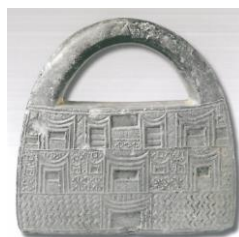
شکل ۹، نقش معماری گونه بر روی اثری از تمدن جیرفت، ماخذ (پیران، ۱۳۹۲)

در توصیف تصویر ۸، مربع هایی با تفاوت کوچکی و بزرگی خودنمایی میکند، خطوط هاشوری، زیگزگی و خطوطی که به صورت ردیف ردیف که جهت آنها به عکس ردیف بعدی می باشد، مشاهده می شود. و نقوش در سه ردیف کنار هم نشستند، به صورت تقارن دو مربع کوچک و مربع در بزرگ در ردیف بالایی قرار دارد. مربع های های کوچک در وسط اثر و مربع های بزرگ در سمت چپ و راست اثر مشاهده می شود. خطوط زیگزگی، نقوش مشبکی و هاشوری هم وجود دارد. که این خطوط هاشوری، بافت حصیر را القا می کند. در مرکز اثر بافت آجری و حصیری در کنار هم آورده شده است. در ردیف دوم با همان نقوش ردیف بالایی روبرو می شویم با این تفاوت که در ترکیب اثر، سه مربع، در ردیف بالا، یک مربع بزرگ در وسط ردیف دوم و مربع کوچکتر در سمت چپ و راست، مربع های کوچک و به همراه ترکیب های هندسی مشاهده می شود. در ردیف سوم ۶ در بزرگ به چشم می خورد و در مجموع دوازده در دیده می شود. در تحلیل تصویر ۸، می توان گفت، نقشمایه معماری را نشان می دهد با درها و پنجره های کوچک و بزرگ با بالکن هایی که دیوار آن ها از حصیر می باشد، خطوط زیگزگی به نشانه آب و باروی در کنار آن ها، پنجره هایی که متشکل از ترکیب هندسی بسیار زیبا می باشد، بطور احتمال جهت وارد شدن نور به درون ساختمان یا این ترکیب ساخته شده باشند. شاید نیای درهای ارسی در خانه های سنتی ایران باشند. خطوط زیگزگ به زیر ساختمان، به چشم می خورد، به نظر می رسد ساختمان جهت پرستش یکی از دو عنصر زندگی بخش آب و خورشید بوده باشد.