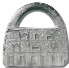
تصویر ۷، نقشمایه پلکانی شکل در نقوش معماری در تمدن جیرفت