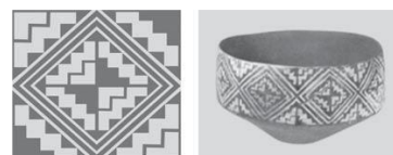
تصویر ۲، سفال شوش، ۳۵۰۰ قبل از میلاد (کامبخش فرد، ۱۳۷۹)

در توصیف تصویر ۲، که سفالی از منطقه شوش است. از جمله ویژگی های این نقش برقراری ارتباطی است که بین نقوش و بخش های آن حاصل آمده است. ریتم و حرکت پله ای نقش ها و جایگزینی مناسب آن ها در فضا های پر و خالی، ترکیبی پویا و متنوع به اثر بخشیده، به طوری که بیننده را گام به گام به مرکز اثر نزدیک می گرداند. تکرار خطوط لوزی در قطرهای اصلی، این توجه را تقویت می کند و بر زیبایی و تنوع نقش می افزاید. در تحلیل تصویر ۲، می توان گفت که با استفاده از ترسیم دقیق اشکال هندسی، که گویی از علم ریاضی گونه ای برخوردارند، با توجه به نقوش زیگزاگی که نشان دهنده آب می باشد، که باروری و برکت را نشان می دهد. شاید می توان گفت، هنرمند ایلامی قصد نقش کردن زمین، را جهت خواستن حاصلخیزی و برکت بیشتر بوده است.