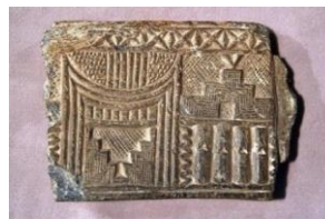
تصویر ۸، نقش معماری گونه ظرف سنگی تمدن جیرفت، مآخذ (پیران، ۱۳۹۲)