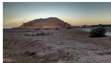
تصویر ۵، بنای معماری بزرگ هنر تمدن ایلام در شوش

در توصیف تصویر ۵، روش بنای «زیگورات»، که خاص ایلام می‌باشد، این بنا، عبارت از برجی پله‌دار بوده که از پایین به بالا، از حجم آن کاسته می‌شده و در طبقه بالا معبد این شوشیناک خدای خدایان قرار داشته‌اند و جایگاه خدایان نامیده می‌شده، و در طبقات دیگر خدایان قرار داشته‌اند. این بنا مجموعه‌ای از هنر معماری نقاشی و لعابکاری زمان است، که اوج هنر ایلام را نشان می‌دهد. در تحلیل تصویر ۵، میتوان گفت این بنا پرستشگاهی برای خدایان و الهگان تمدن ایلام بوده است، به نظر می‌رسد نقوش پلکانی گویی عروج انسان را نشان می‌دهند. انسان با احترام و پرستش همچون پله‌ها، به صورت طبقه بندی مقام‌های خدایان، رفته رفته به بندگی خدای خدایان می‌رسیده است.