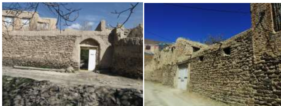
شکل 5- سنگ‌های رودخانه‌ای به عنوان مصالح دیوار منازل

بافت مسکونی روستای هزاوه پیچیده و جالب است و نوع خاص و هنرمندانه معماری سنتی و روستایی در این نقطه رقم خورده است، معماری ساخت روستا تحت تاثیر عوامل جغرافیایی و وجود آب در چهار قسمت عمده متمرکز شده است و خانه‌ها از جنس سنگ، گل و چوب به صورت پلکانی، بردامنه شیب کوه‌ها قرار گرفته و دارای سقف‌های مسطح هستند. همچنین به دلیل حاکم بودن اقلیم معتدل و سرد در طول سال، ساختمان‌های روستا رو به جنوب و با دیوارهای ضخیم ساخته شده تا حداکثر استفاده از نور خورشید برده شود و ایجاد اتاق کرسی از ویژگی‌های معماری روستای هزاوه است. خانه‌های هزاوه را بیشتر روی صخره و کوه ساخته‌اند و هر واحد معماری آن در روستا اجزای متعددی دارد. دروازه‌های ورودی با درهای چوبی، واحدهای ساختمانی اکثراً در دو طبقه ساخته شده‌اند و حیاط از جمله‌ی آن بخش‌ها هستند. دیوار خانه‌ها اکثراً ضخیم و از جنس خشت، چینه و گل است و به طور کلی شکل خانه‌ها به گونه‌ای است که فضاهای اصلی از طریق یک فضای رابط یا واسطه مانند راهرو به یکدیگر مربوط شده‌اند تا اتلاف دما به واسطه‌ی باز و بسته شدن در به حداقل برسد. بیشتر ساختمان‌های روستا در دو طبقه هستند که طبقه‌ی پایین آنها برای دام و طبقه‌ی دوم برای سکونت افراد بوده است. موضوع خاص معماری در روستای هزاوه که آن را از سایر نقاط روستایی متمایز می‌کند استفاده از سنگ‌های رودخانه‌ای و چیدمان هنرمندانه آن در دیوار منازل و مساکن و سایر اینه روستا است که نمونه آن در زیر مشاهده می‌گردد.