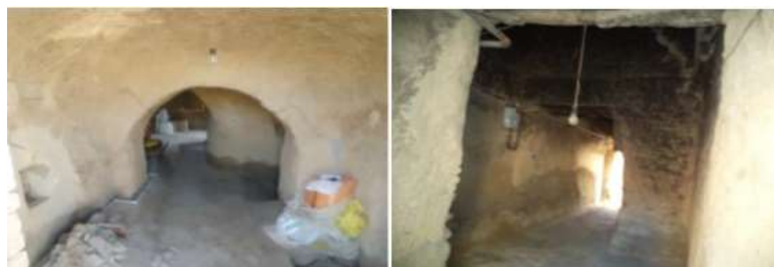
شکل 6- شکل نمونه دالان‌های ورودی به داخل حیاط

دالان راهروی باریکی است که با پیچ و خم وارد شونده را از دروازه ورودی به حیاط خانه هدایت می‌کند در اکثر خانه‌ها برای رعایت حریم خصوصی، دالان‌ها دارای پیچ و خم هستند تا عابران نتوانند سریعاً فعالیت‌های حیاط را متوجه شوند. دالان‌ها اغلب به شکل هشت ضلعی یا نیمه هشت ضلعی و یا بیشتر مواقع چهار گوش و به تبع از شرایط اقلیمی منطقه طراحی شده است و قسمت‌های مختلف طبقه پایین را از هم جدا می‌کنند و در بسیاری از منازل قدیمی راه پله طبقه بالا در دالان تعبیه شده است.