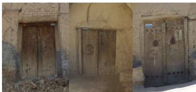
شکل 10- انواع دربهای چوبی ورودی

در منازل قدیمی درها تماما از جنس چوب بوده و حتی به جای لولا در روی پاشنه می چرخیده و طبق بررسی های میدانی در این درها معمولا به ضخامت 10 الی 15 سانتی متر تخته است که از چوب صنوبر ساخته می شد.