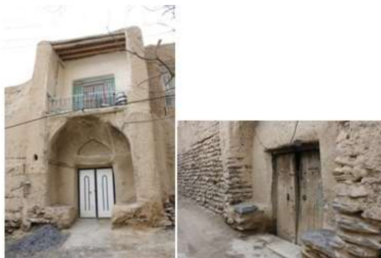
شکل 8- سکوی ورودی منازل روستا

سکویی است که در دو سوی در ورودی، برای استراحت در هنگام انتظار برای ورودی یا گفت و گو با همسایه‌ها و یا استراحت و نشستن خود اهالی خانه در نظر گرفته شده است در معماری سنتی به این سکوها پیر نشین گفته می‌شود.