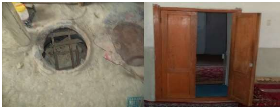
شکل 13- در ورودی و تنور اتاق کرسی در یک خانه قدیمی در محله میان ده