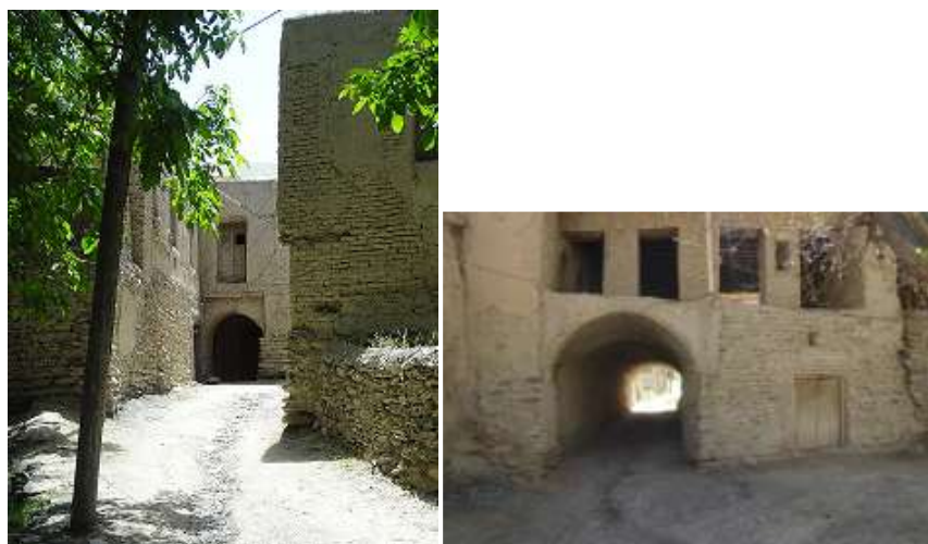
شکل 9- ساباط

در محلات پایین ده و میان ده و کوهبر ویژگی خاصی در معماری برخی منازل وجود دارد و آن هم کوچه های اختصاصی و سرپوشیده ای است که محرمیت خاصی را برای یک یا چند واحد مسکونی ایجاد می کرد و کاربرد های دیگری هم داشته است.