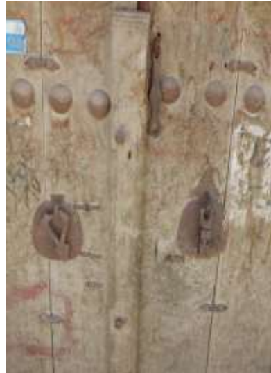
شکل 11- نمونه کوبه های درب های قدیمی

کوبه بخشی از آن است. درب های چوبی که در خانه های قدیم استفاده می شد معمولا دو لته یا دو لنگه بودند، روی هر لته آن کلونی نصب می شد که کلون دایره ای (حلقه ای) شکل مورد استفاده خانم ها بود و کلون دیگر برای آقایان.