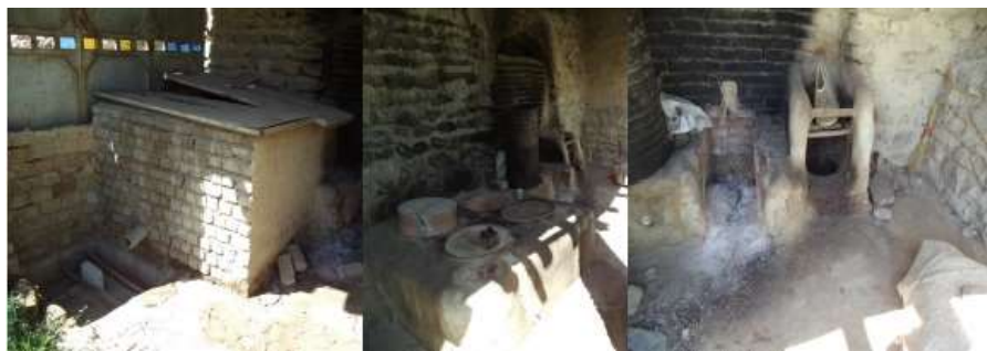
شکل 12- سیستم فرآوری انگور در روستای هزاوه

در روستای هزاوه دانش بومی وجود دارد که انگور را به محصولات نظیر کشمش، باسلق، شیره انگور تبدیل می کند و این موضوع در کالبد واحدهای مسکونی نیز قابل مشاهده است. این محل از چهار قسمت اصلی چاله انگور، کوره و گل چک و اجاق تشکیل شده است.