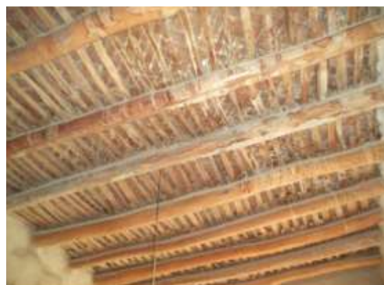
شکل 17- نمونه بام