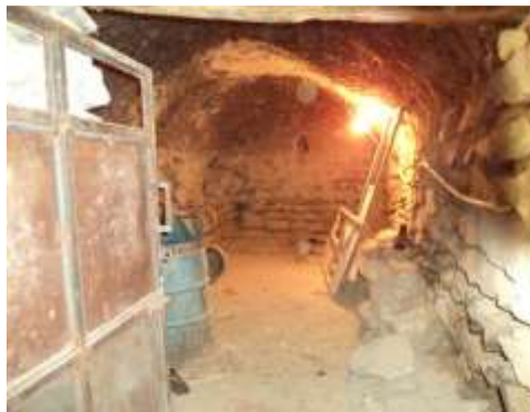
شکل 14- فضای داخلی یک آغل در خانه های محله تره زار

یکی از بخش های مهم اقتصادی در روستای هزاوه نگهداری و پرورش دام سبک و سنگین می باشد. بنابراین بخش مهمی از فضاها جهت نگهداری از دام مورد استفاده قرار می گیرد.