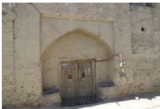
شکل 7- سردر ورودی منازل روستا

در اکثر خانه‌های قدیمی روستای هزاوه هلال ساده‌ای روی در قرار دارد و معمولا طوری ساخته می‌شده که در زمستان‌ها مانع از ریزش بر و باران بوده و در تابستان‌ها نیز مانعی برای تابش مستقیم آفتاب به شمار می‌رفته است. در برخی خانه‌های قدیمی هنوز هم بالای سردر کتیبه‌هایی از آیات قرآنی به چشم می‌خورد.