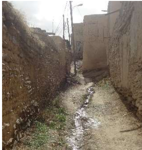
شکل 18- نمونه ناودانها در محله پایین ده

با توجه به اینکه سطح بامها در روستای هزاوه مسطح می باشد و دیوار ها گلی است، ناودانها طوری مستقر شده اند که آب باران را با فاصله مناسب از دیوار به جوی وسط کوچه ها هدایت می کنند.