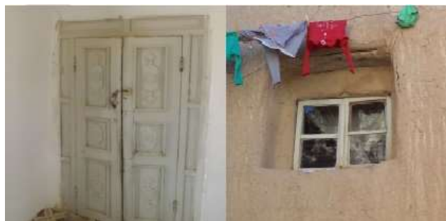
شکل 15- نمونه پنجره و در اتاق کرسی در محله میان ده

در منازل قدیمی روستای هزاوه طبقه اول فقط یک در ورودی به دالان یا حیاط دارد و یک دریچه کوچک جهت تهویه هوای داخل آغل ها در نظر گرفته شده است و در طبقات بالا که جهت سکونت مورد استفاده قرار می گیرد هر اتاق معمولا دو یا سه پنجره در یک طرف اتاق دارد و در اتاق کرسی دو پنجره در دو طرف شمالی و جنوبی تعبیه شده که برای عبور جریان طبیعی هوا طراحی شده است.