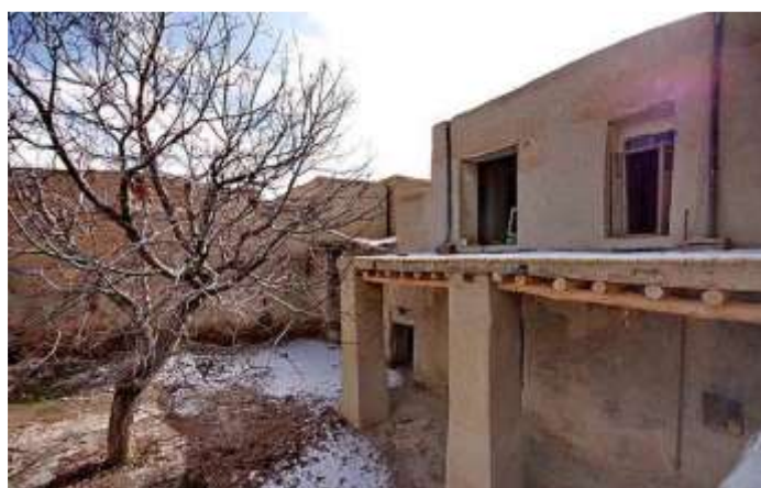
شکل 17- حیاط

حیات در خانه های قدیمی هزازه مرکز خانه می باشد و جایی است که تمام فعالیت های اقتصادی خانواده با آن در ارتباط می باشند در تمامی منازل روستای هزازه حیاط وجود دارد و بخشی مهمی از فضای زندگی روستایی را شامل می شود.