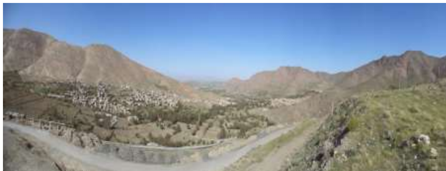
شکل 4- پانوراما از محلات مختلف روستا

این روستا دارای بافت پیچیده ای است که از خانه های سنگی، گلی به صورت پلکانی، بردامنه شیب کوه ها قرار گرفته و در کنار مزارع و باغات انگور، این خانه ها اکثراً از ملات گل، سنگ و چوب ساخته شده و دارای سقف های مسطح هستند. معماری ساخت روستا تحت تأثیر عوامل جغرافیایی و وجود آب در مناطق محله در دو قسمت عمده و شش محله متمرکز شده اند که با احتساب امامزاده هفت محله قومی و فرهنگی در این روستا قابل تشخیص است. از نظر کالبدی روستا در دویخش عمده محلات شمالی و محلات جنوبی که در امتداد دو مسیل اصلی شکل گرفته اند قابل تقسیم بندی است. نام محله ها به ترتیب ده به سمت بالا عبارت اند از: کوهبر، میان ده، محله پایین، محله چاله، سرآسیاب، تره زار و ده بالا. نکته قابل توجه در محلات روستا این است تمامی محلات حول یک مکان مقدس از جمله مسجد و حسینیه شکل گرفته اند که به عنوان مرکز محله، مرکز تجمع ساکنین محله محسوب می گردند.