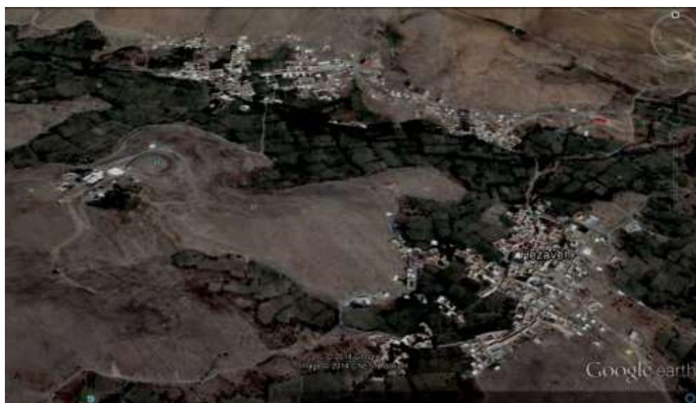
شکل 2- عکس هوایی از موقعیت و نشستگاه طبیعی روستای هزاوه

روستای هزاوه از نظر طبیعی در یک موقعیت بن بست قرار دارد و از شمال با روستای داین و از شمال شرق با روستای مهرآباد همسایه است، سایر جهات روستا را تپه‌ها احاطه نموده‌اند که به لحاظ موقعیت استقرار دارای موقعیت کوهپایه‌ای و به لحاظ شکل استقرار در بافت اصلی متراکم می‌باشد.