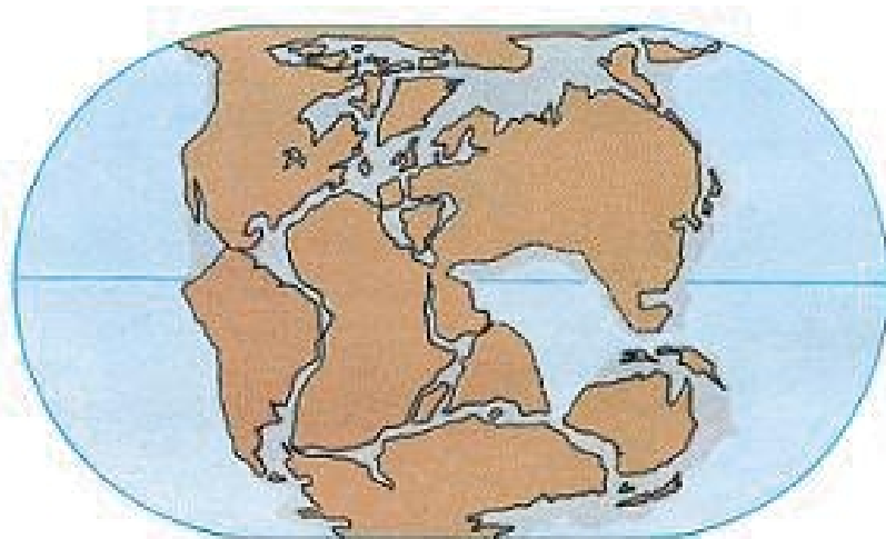
شکل 2. قاره های موجود در پوسته زمین که ابتدا بصورت یاپاچه در کنار هم بودند و سپس انشقاق یافته و از همدیگر فاصله گرفتند.