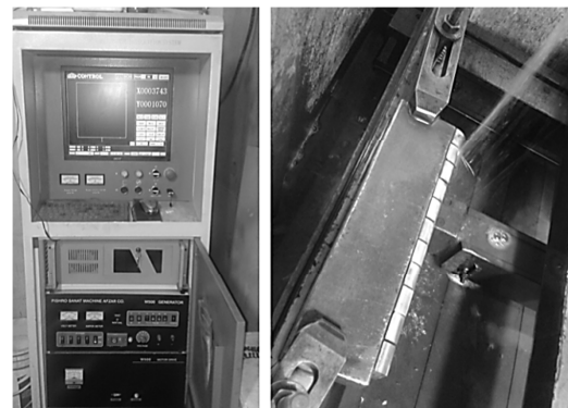
شکل ۱ نمایی از دستگاه برش کاری تخلیه الکتریکی سیمی و نمونه‌های برش-کاری شده

در سال‌های اخیر سیستم‌های هوشمند مبتنی بر مدل‌های پیشگو بطور قابل ملاحظه‌ای گسترش یافته‌اند و از مزایای آنان در علوم مختلف بهره گرفته شده است. از جمله این علوم می‌توان به فرآیندهای ساخت و تولید اشاره نمود که محققین از این روش‌ها جهت پیشبرد اهداف خود در انواع فرآیندهای تولیدی بهره برده‌اند [۱۰،۹].