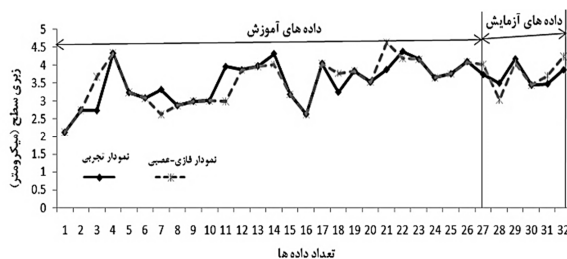
شکل ۴ مقایسه‌ی بین نتایج تجربی و نتایج خروجی از شبکه‌ی فازی-عصبی زبری سطح

هر لایه، نتایج به دست آمده از گره در لایه قبلی می‌باشد. شکل ۲ نمایی از یک شبکه فازی-عصبی با سه ورودی و یک خروجی نشان داده شده است. آموزش شبکه فازی-عصبی عملکردی مشابه با شبکه عصبی دارد با این تفاوت که پارامترهای تابع عضویت ورودی به گونه‌ای محاسبه می‌گردند که سیستم استنتاج فازی بر مجموع داده‌های ورودی و خروجی منطبق گردند. از مزایای استفاده از شبکه‌های فازی-عصبی این است که، مدل آموزش داده شده توسط این شبکه دارای خطای کمتری نسبت به شبکه عصبی می‌باشد. مدل آموزش داده شده توسط این شبکه به راحتی می‌تواند با استفاده از روش ترکیبی خروجی را براساس ورودی داده شده تخمین بزند. به همین منظور از شبکه فازی-عصبی به منظور ارائه مدل پیشگویانه از فرآیند ماشین‌کاری نقش بسیار حائز اهمیتی در صحت پیش‌بینی خروجی‌های ماشین‌کاری دارد.