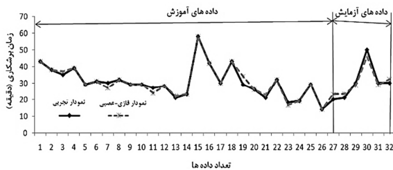
شکل ۳ مقایسه‌ی بین نتایج تجربی و نتایج خروجی از شبکه‌ی فازی-عصبی زمان برش کاری