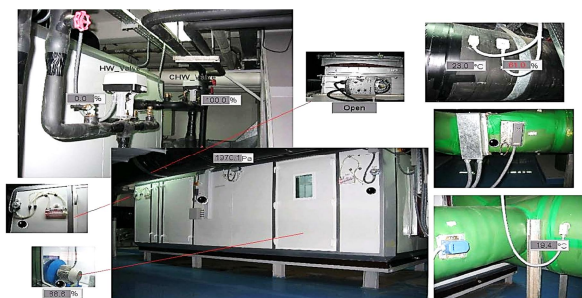
Fig. 2 AHU of clean room

هواساز مدل شده در این پژوهش دارای زیر سیستم‌های، کویل سرد و گرم، فن هوای رفت و رطوبت‌زن، "شکل 2"، که رفتار کویل سرد و گرم را به روش جعبه خاکستری و رطوبت‌زن و فن به شیوه جعبه سفید شبیه‌سازی شده اند.