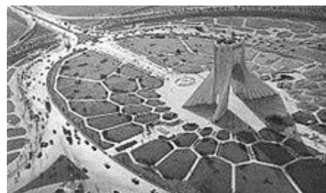
شکل (۳): برج آزادی، تلفیق معماری پیش از اسلام و دوران اسلامی در زمان معاصر

در پژوهش حاضر جغرافیای معماری ایران، جغرافیای فعلی مورد نظر بوده است. توجه به معماری ایرانی، دیدگاه‌های مختلفی را در بر می‌-