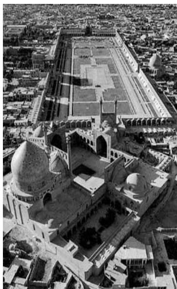
شکل (۵): میدان نقش جهان، بهره‌گیری از شاخص‌های مادی و معنوی

در شکل (۴) دسته‌بندی فوق با زیرشاخص‌های هر یک معرفی شده است. قابل ذکر است این موارد می‌تواند تکمیل شود.