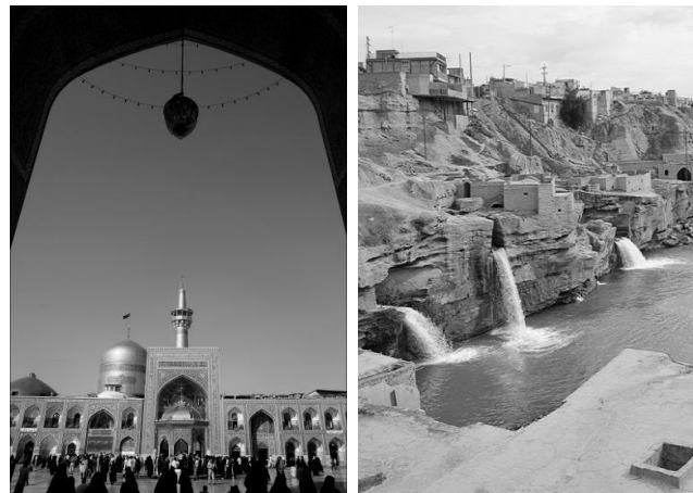
شکل (۱): سازه‌های آبی شوشتر در دوران پیش از اسلام، بعنوان یک مجموعه صنعتی عظیم شکل (۲): بارگاه مطهر حضرت امام رضا (ع)، ارسن اطراف آن گنجینه معماری سنتی ایران است

معماری ایرانی شامل اقلیم، فرهنگ و گونه‌های ساختمانی مختلف می‌شود. به این ترتیب «می‌توان به دقت خصوصیات کالبدی مشترک و واحدی را برای معماری خشتی-گلی حاشیه کویر، معماری چوبی گیلان، آلاچیق‌های ترکمن، معماری سنگی هخامنشی و غیره عنوان کرد» [۱] شکل‌های شماره (۱،۲،۳). با مطالعه دیدگاه صاحب‌نظران مختلف می‌توان بیان داشت با وجود تفاوت‌ها، اشتراکات زیادی در شاخص‌های معماری و در طول زمان وجود داشته است که امروزه از آنها با عنوان معماری ایرانی یاد می‌شود. در واقع «با وجود کمبودها و دیدگاه‌های متفاوت موجود، نوعی همدلی میان صاحب‌نظران ایرانی آشنای با معماری ایران در وجوه اصلی این معماری دیده می‌شود که دشواری‌های پرداختن به آن را با وجود گستردگی این موضوع کمتر می‌سازد» [۲].