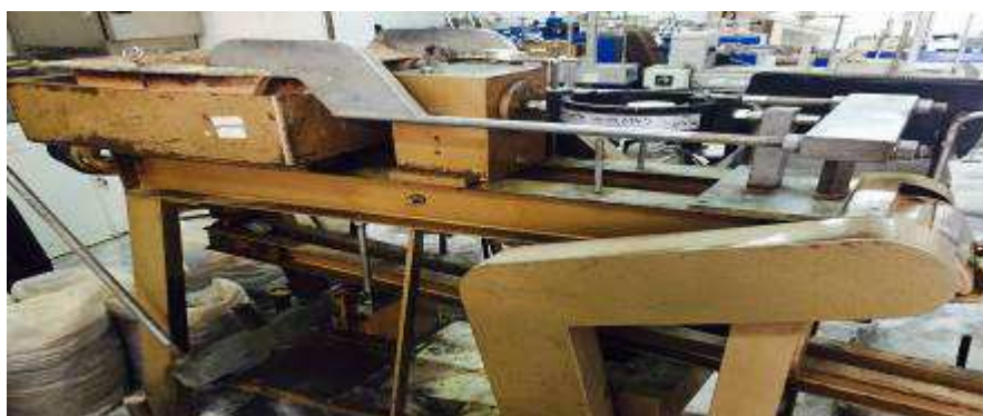
شکل ۲- دستگاه برش مستقیم استاندارد ۳۰*۳۰

روش‌های مختلفی برای اندازه‌گیری مقاومت برشی خاک ارائه شده است که مهم‌ترین این روش‌ها عبارتند از تست‌برش مستقیم یا جعبه برش و تست سه محوری. روش جعبه برش مستقیم (direct shear testing) بدلیل سادگی و آسان بودن کار کاربرد زیادی در تعیین مقاومت برش خاک داشته است و در این تحقیق نیز از روش جعبه برش استفاده شده است (شکل ۲).