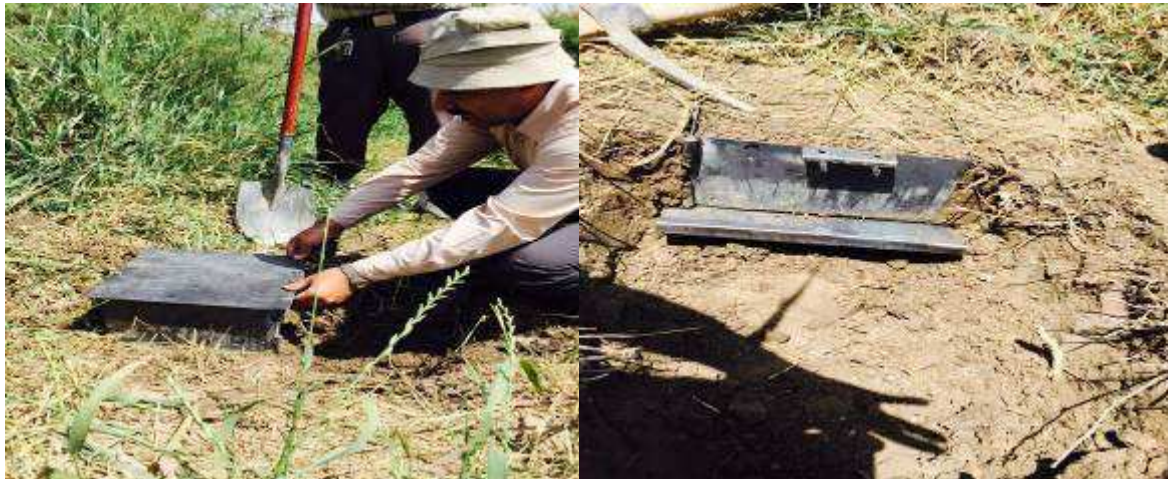
شکل ۳- نمونه برداری به وسیله قالب

در این مرحله از تحقیق حاضر به منظور بررسی مقاومت برشی خاک تحت تاثیر ریشه های گز در مجموع ۳ نمونه خاک دست نخورده حاوی ریشه و ۳ نمونه خاک دست نخورده بدون ریشه تهیه گردید. لذا در مجموع ۶ آزمایش برش مستقیم (shear direct) با دستگاه برش مستقیم استاندارد ۳۰*۳۰ سانتیمتر در آزمایشگاه مکانیک خاک اداره راه و شهرسازی مشهد تحت بارهای قائم ۰/۵، ۱/۵ و ۳ کیلوگرم بر سانتی متر مربع با سرعت ثابت ۱ میلیمتر در دقیقه و دور تند انجام گردید.