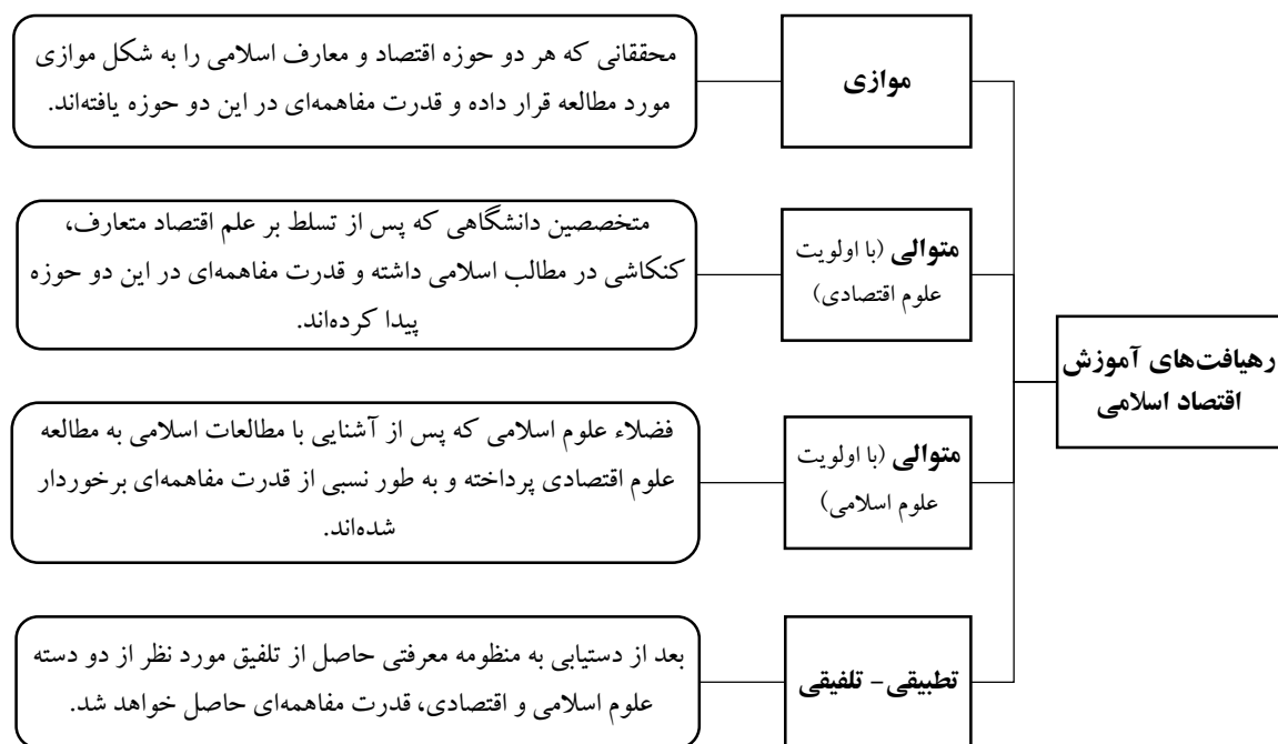
شکل ۳. چهار رهیافت آموزش اقتصاد اسلامی در حال حاضر