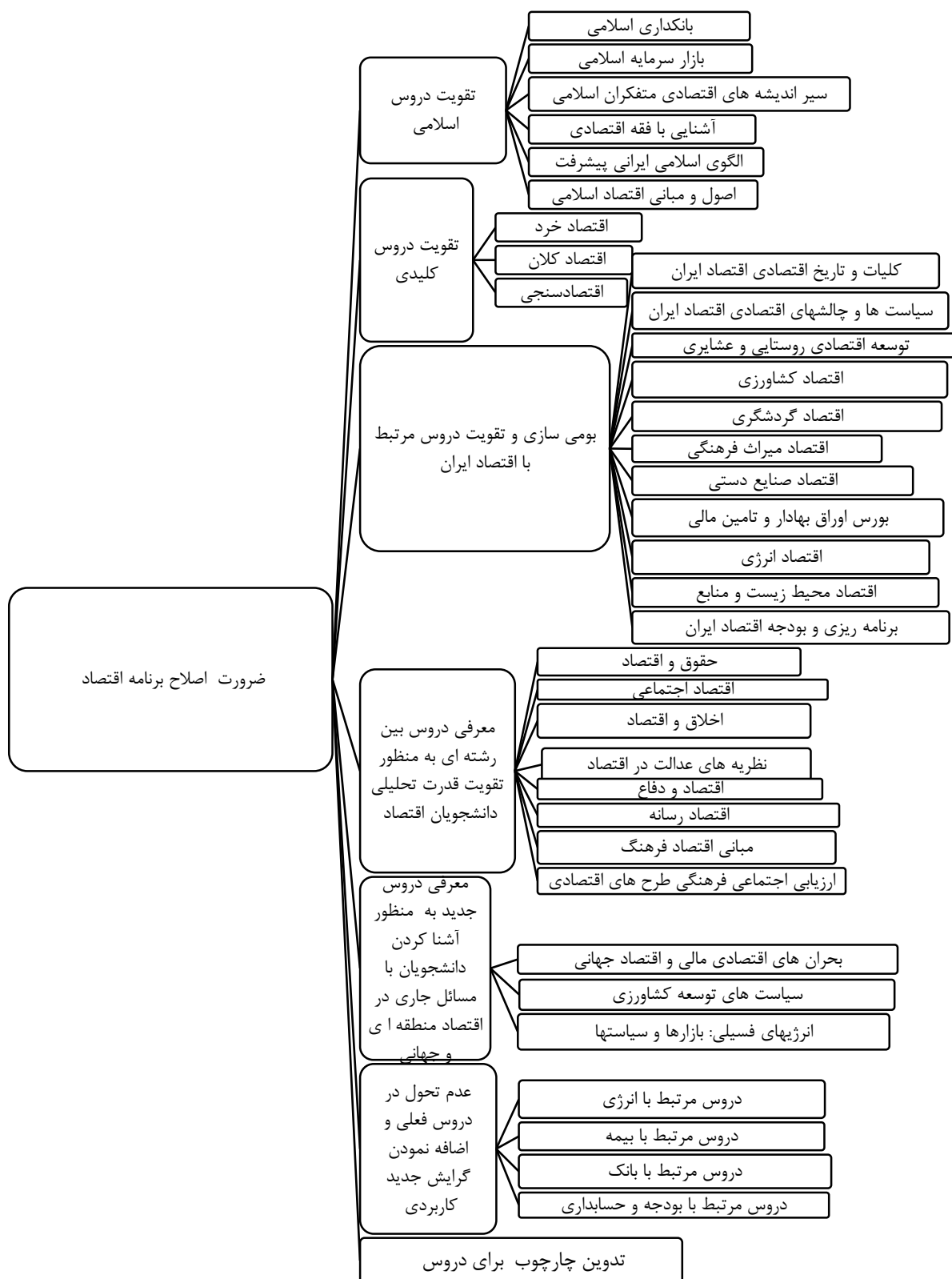
نمودار ۱. ساختار تحلیل